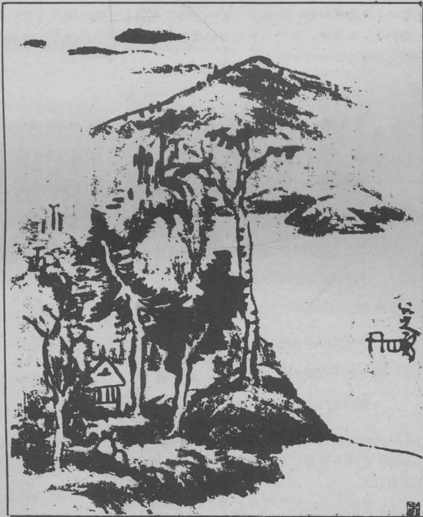
中國名畫 山水——八大山人作