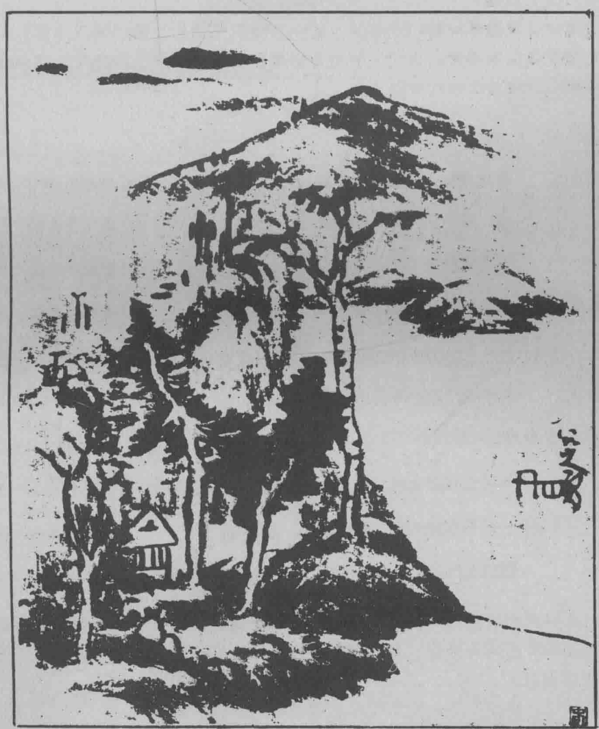
中國名畫 山水——八大山人作