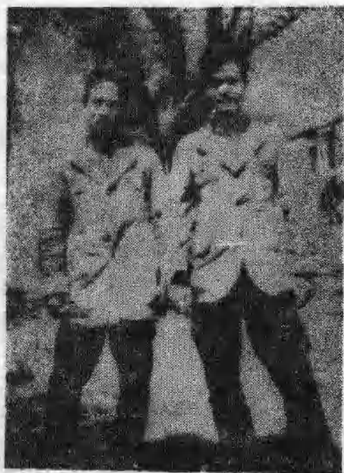
一九四〇年三月三十一日，八路军在阳泉俘虏之日本宣抚官 浦田正雄（日本人）与彭锡春（台湾人）。