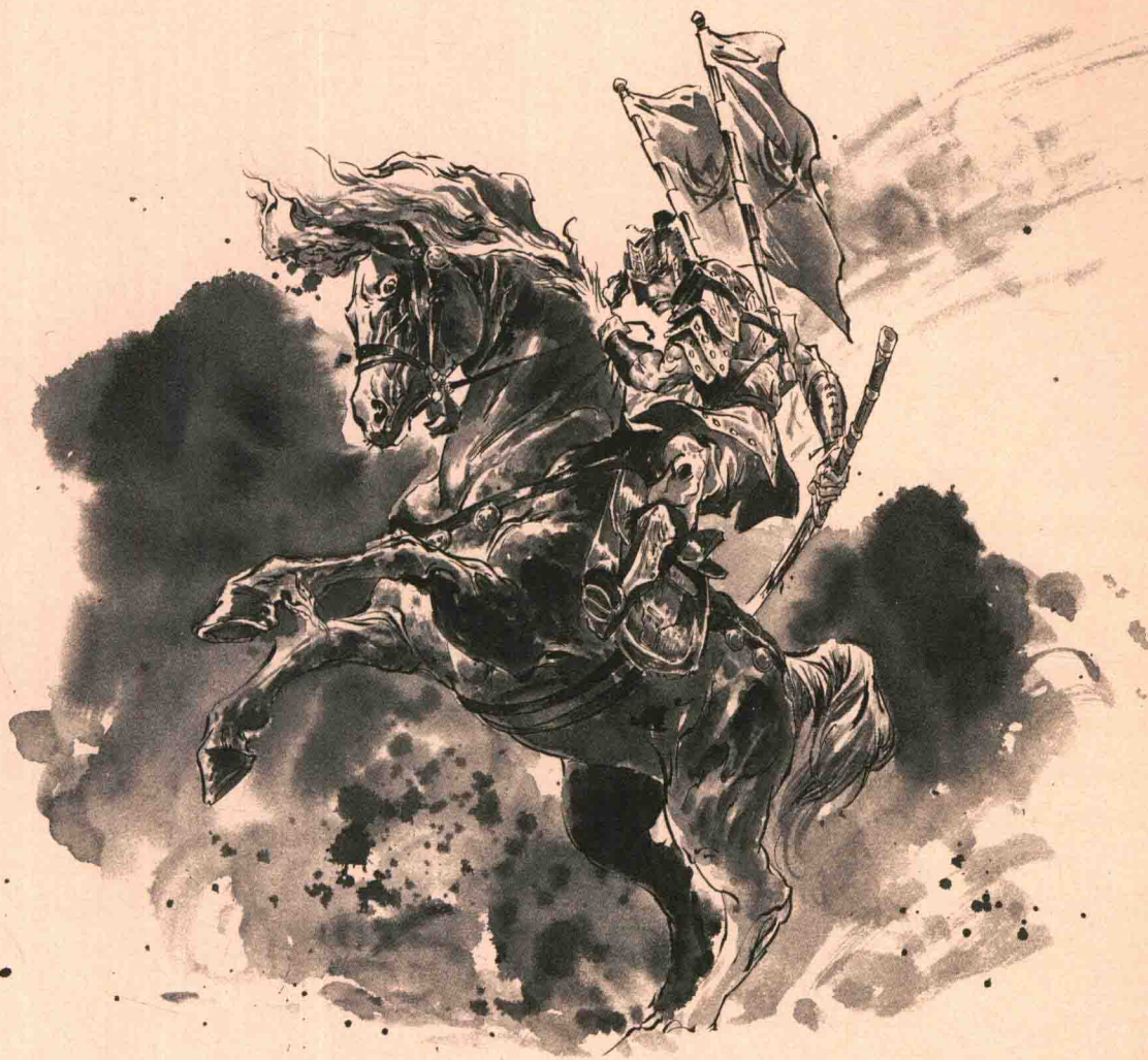
雷 骑 士 兵