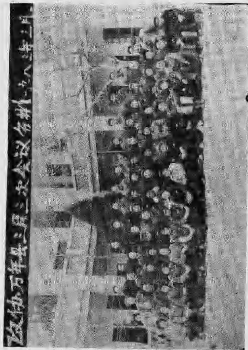
县政协三届三次全委会合影