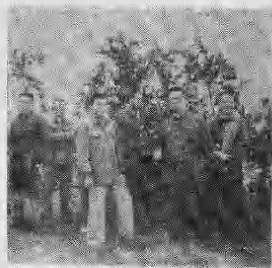
万年县政协委员视察马家乡柑桔园