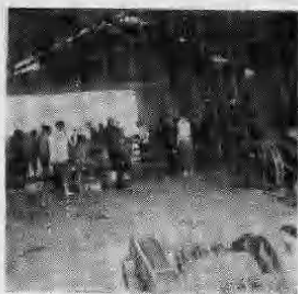
万年县政协委员视察珠山乡瓦砖厂