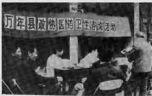
万年县政协医药卫生工作组开展咨询服务活动