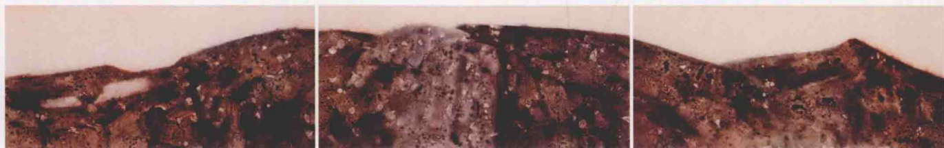
平山 26cm × 162cm