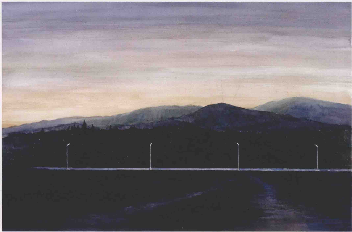
通途 66cm × 101cm