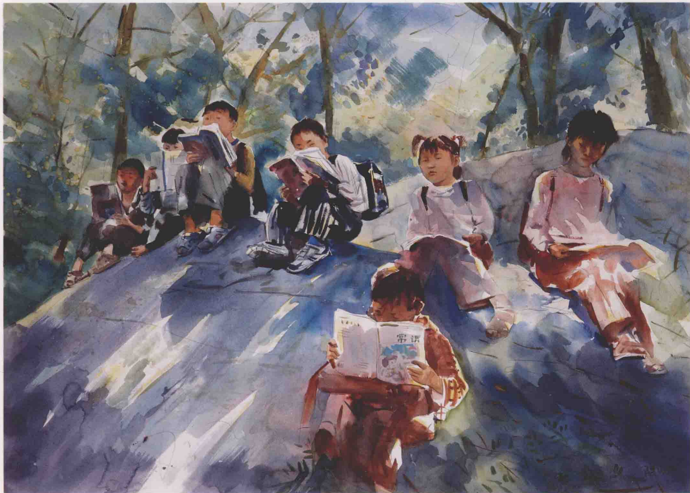
静静流淌的时光 78.5cm × 109cm