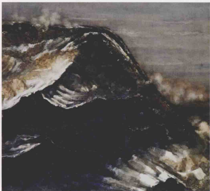
山魂 No.1-4 50.5cm x 54.5cm x 4