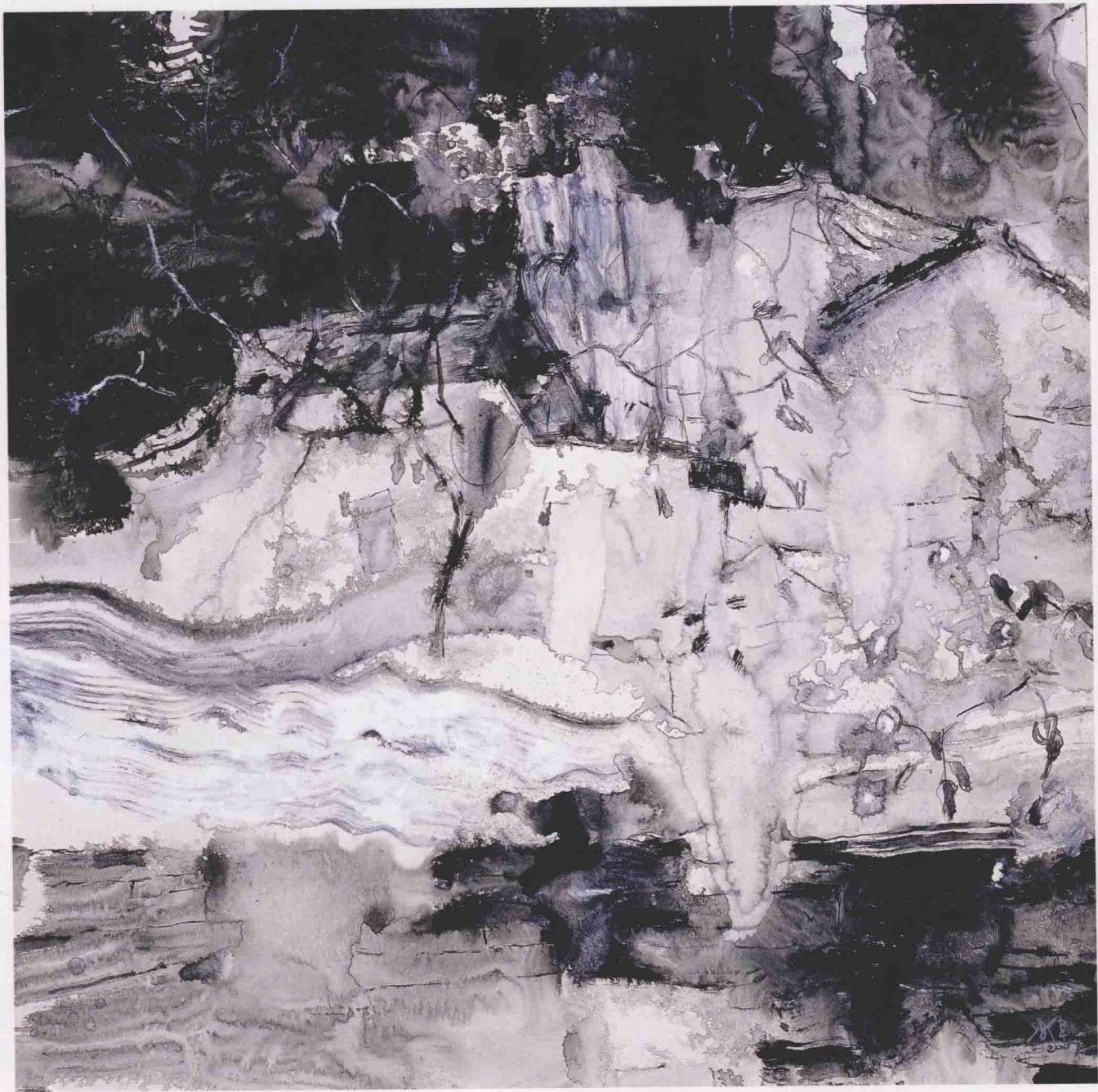
银色的村落（之一） 70cm x 70cm