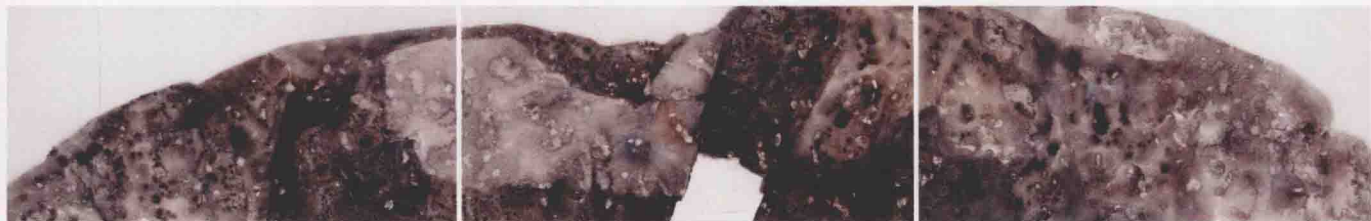
它山 26cm × 162cm