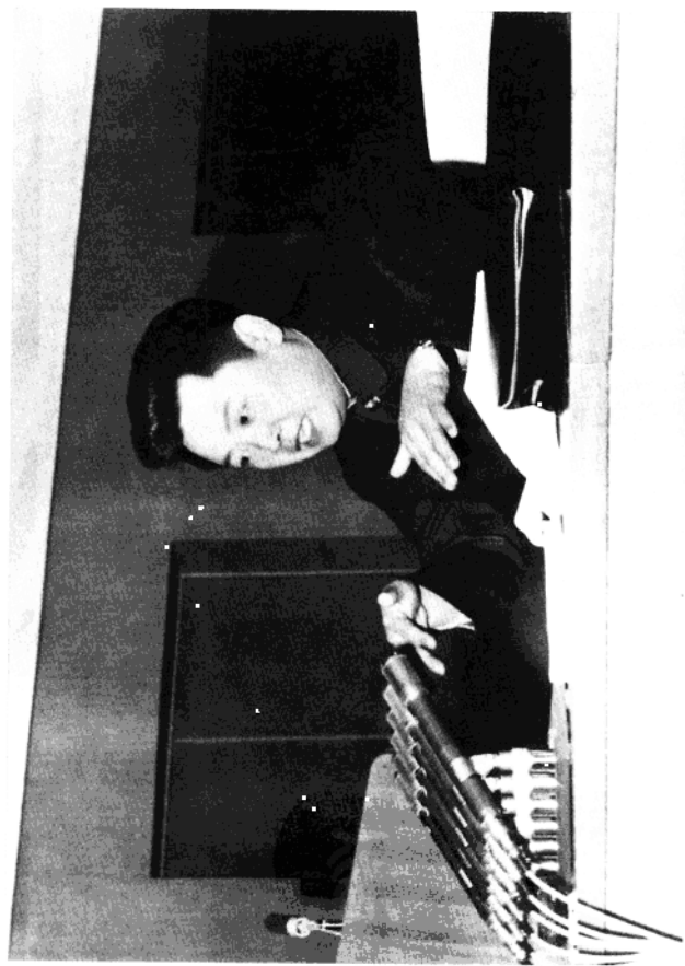
亲爱的金正日同志在全国党的宣传工作者讲习会上作结论。