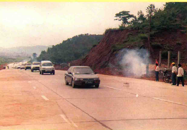
206 国道平远段