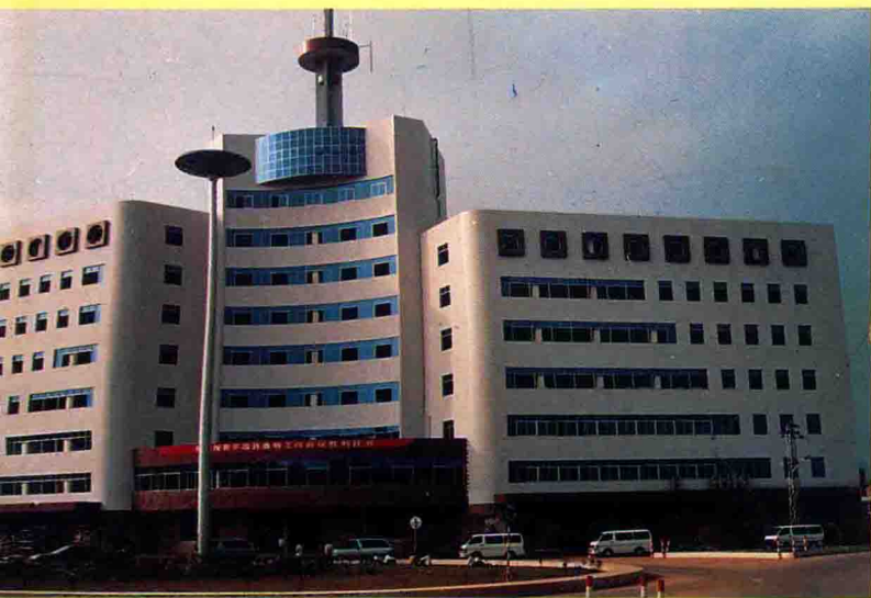
平远邮电大楼