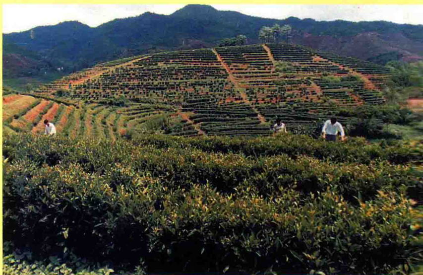
七娘山单丛茶场一角