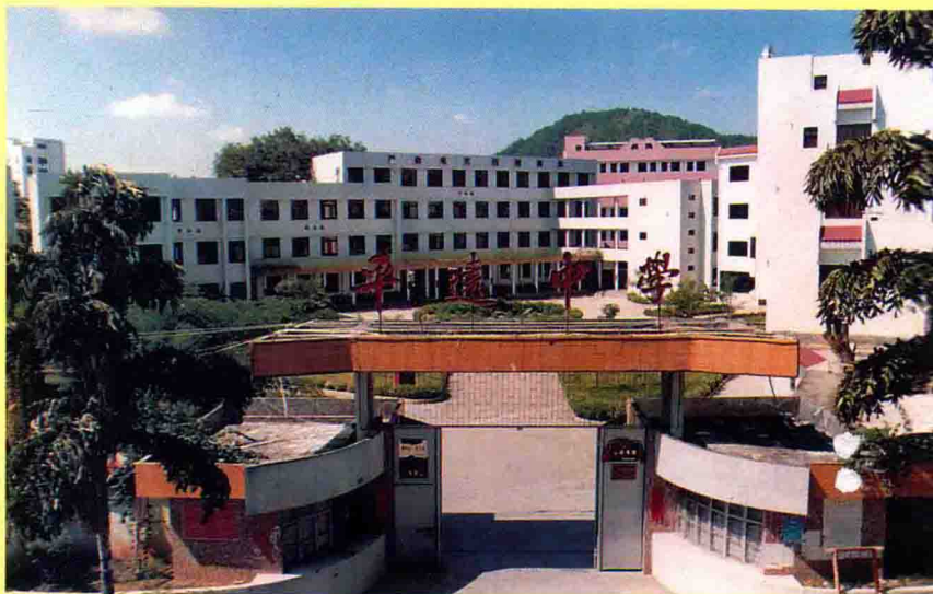
平远中学校园一角