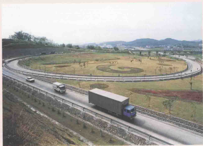
佛开高速公路陈山出入口