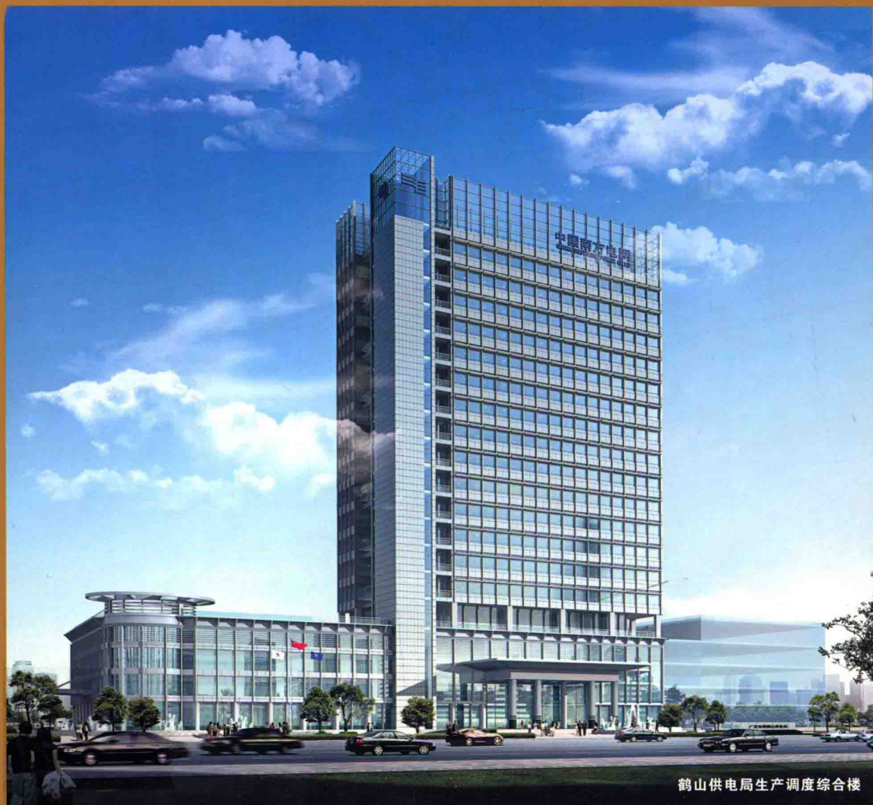
鹤山供电局生产调度综合楼