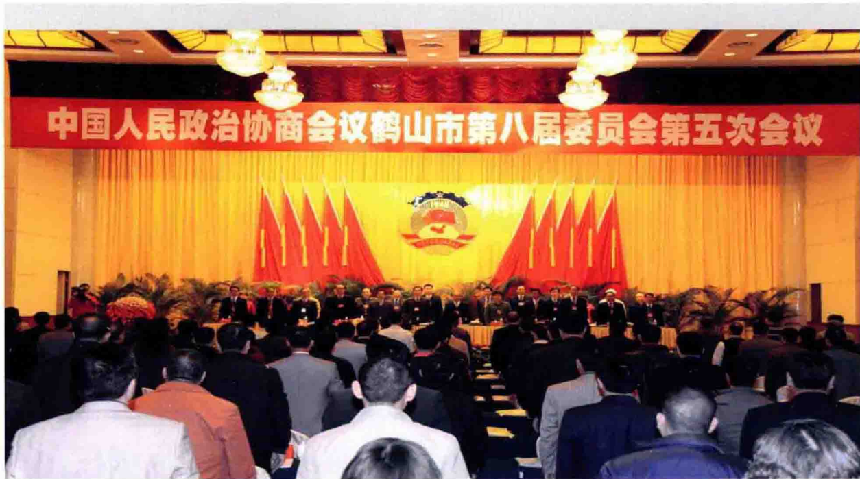
2010年3月10-11日，中国人民政治协商会议鹤山市第八届委员会第五次会议召开