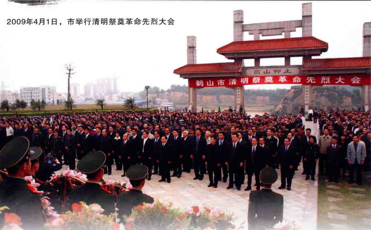
2009年4月1日，市举行清明祭奠革命先烈大会