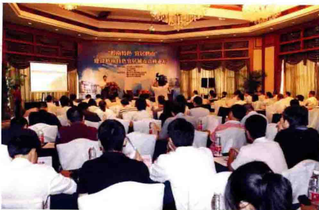
2010年7月8日，由市委宣传部、江门日报和中国江门网联合主办的建设岭南特色宜居城市高峰论坛在鹤山召开