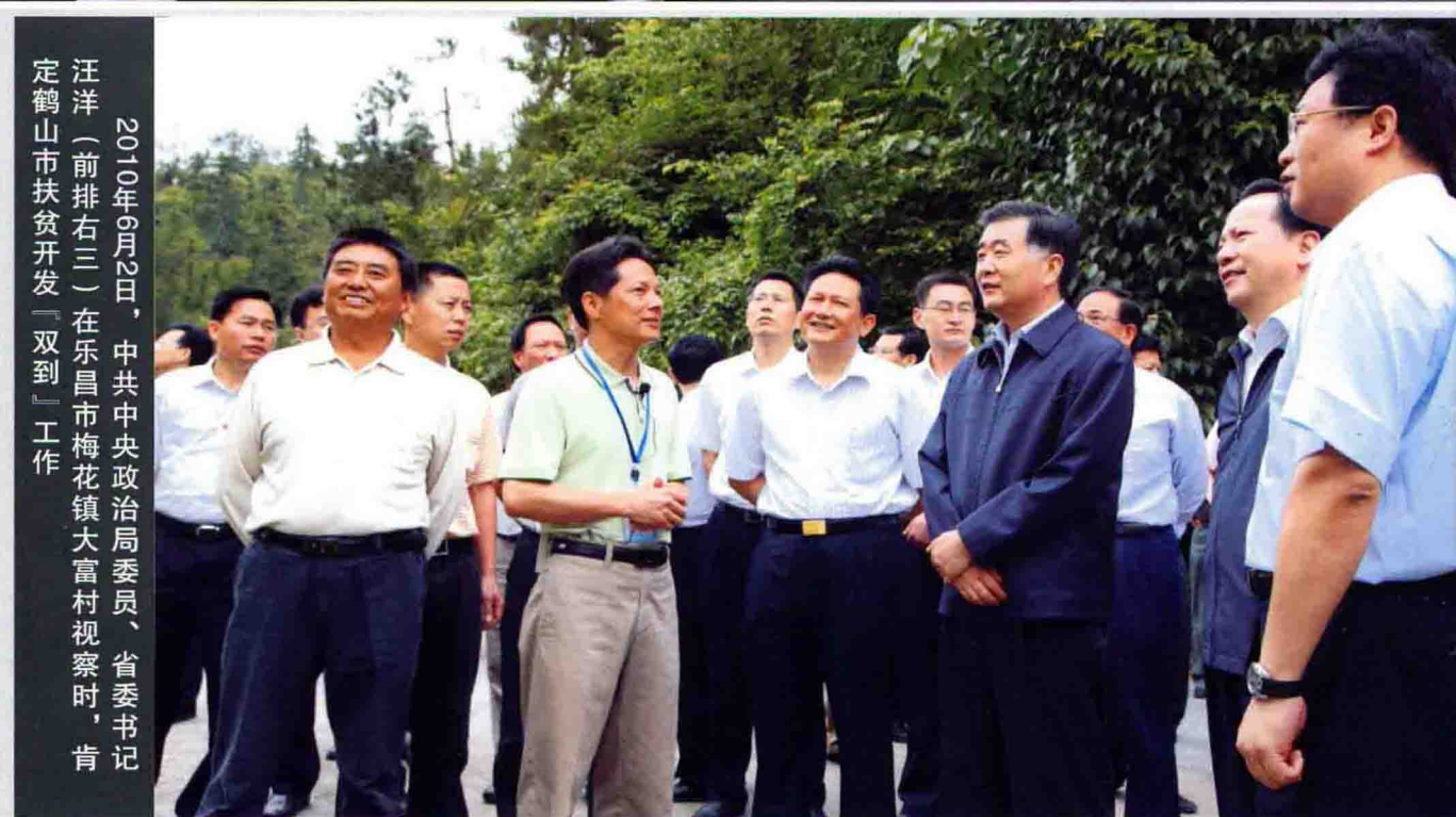
2010年6月2日，中共中央政治局委员、省委书记汪洋（前排右三）在乐昌市梅花镇大富村视察时，肯定鹤山市扶贫开发「双到」工作