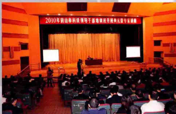
2010年4月9日，市举行科级领导干部培训班开班典礼暨专家讲座