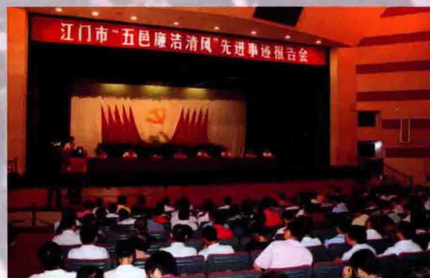
2009年8月24日，市召开“五邑廉洁清风”先进事迹巡回报告会