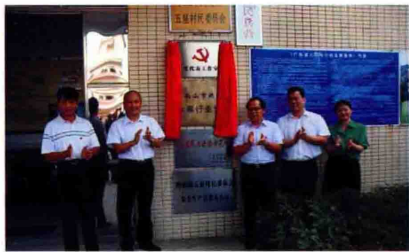
2010年10月15日，全市首家党代表工作室在鹤城镇五星村挂牌成立