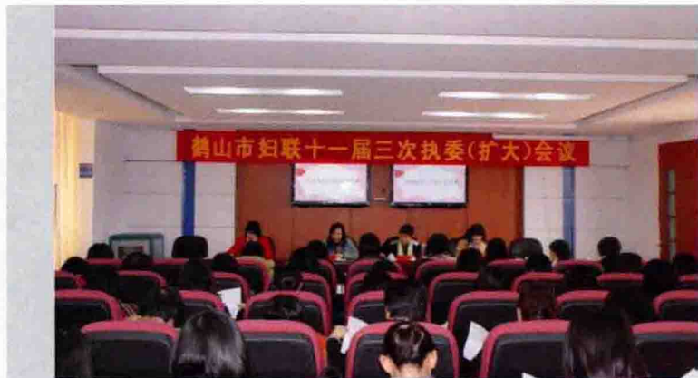
◀ 2010年1月6日，鹤山市妇联召开十一届三次执委(扩大)会议