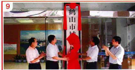
1 2009年11月10日，市农村信用合作联社挂牌成立