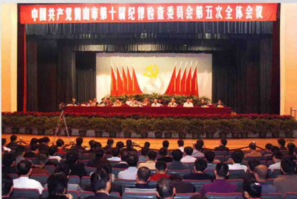
2010年2月9日，中共鹤山市第十届纪律检查委员会第五次全体会议在鹤山剧院召开