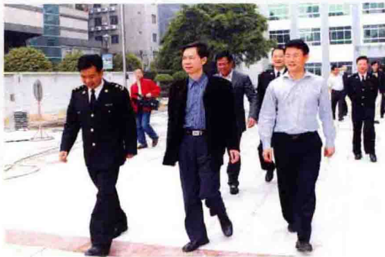
2010年2月2日，市委书记郭伟到鹤山海关慰问