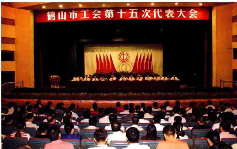
◀ 2009年9月25日，鹤山市工会第十五次代表大会在鹤山剧院召开