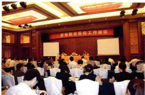
2010年7月14日，全省粮食调控工作会议在鹤山召开