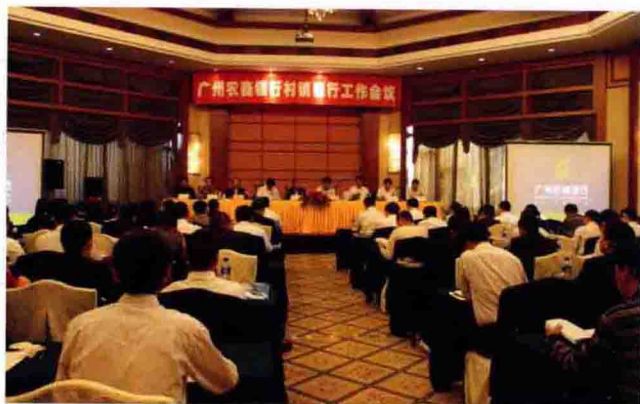
2010年12月2日，广州农村商业银行珠江村镇银行工作会议在鹤山召开