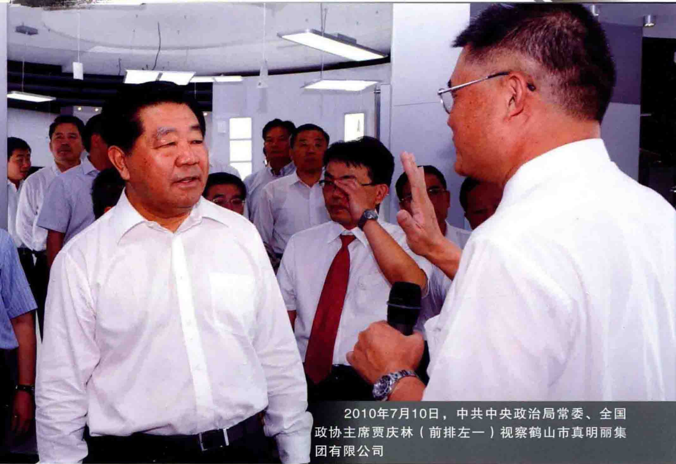
2010年7月10日，中共中央政治局常委、全国政协主席贾庆林（前排左一）视察鹤山市真明丽集团有限公司