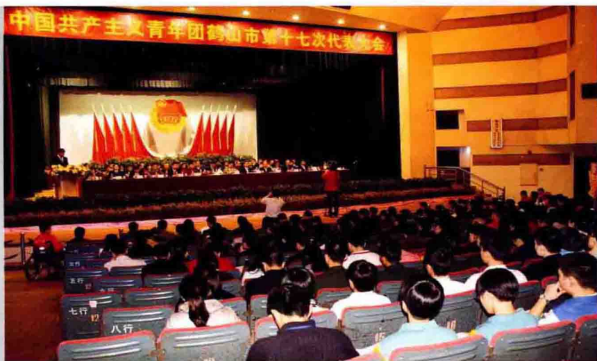
▶ 2009年12月9日，中国共产主义青年团鹤山市第十七次代表大会在鹤山剧院召开