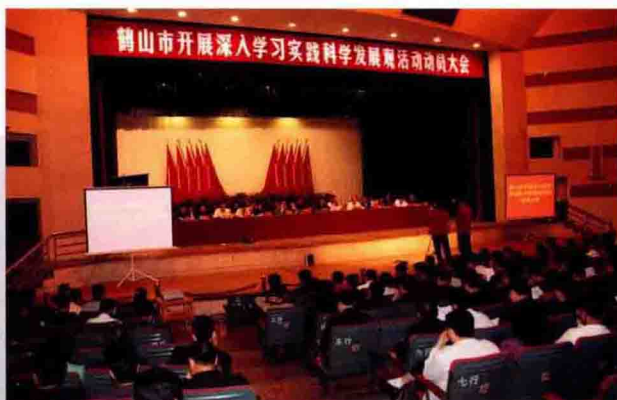
2009年3月16日，市召开开展深入学习实践科学发展观活动动员大会