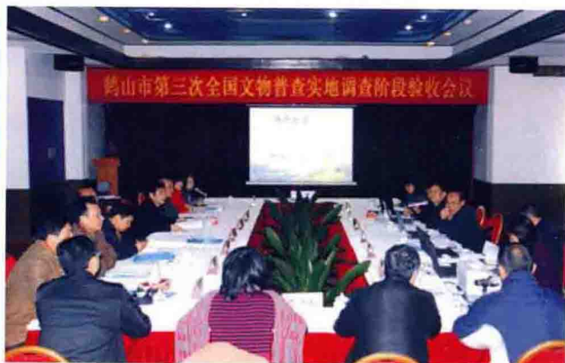
2010年3月9日，省专家组到鹤山检查验收全国文物普查工作