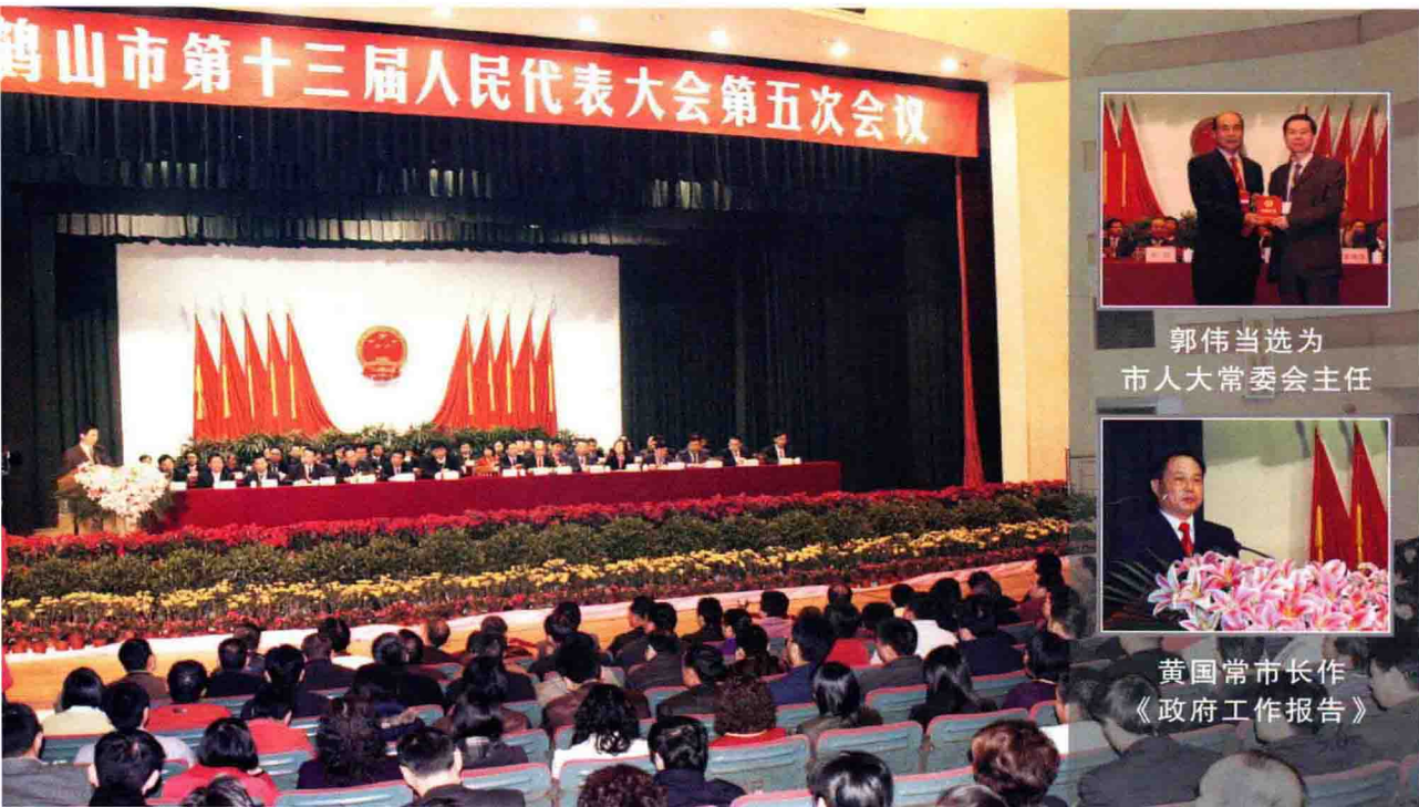
郭伟当选为 市人大常委会主任