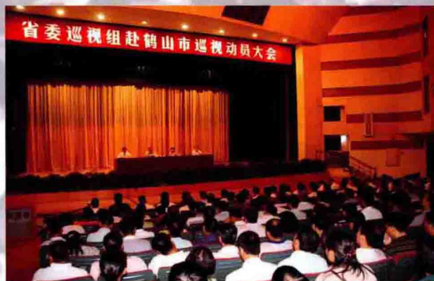
2010年8月13日，市召开省委巡视组赴鹤山市巡视动员大会