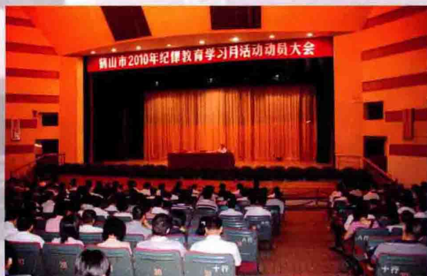
2010年7月5日，市召开2010年纪律教育学习月活动动员大会