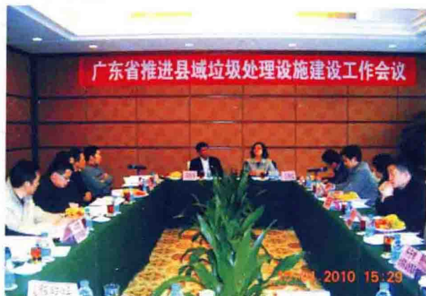
2010年4月15日，广东省推进县域垃圾处理设施建设工作会议在鹤山召开