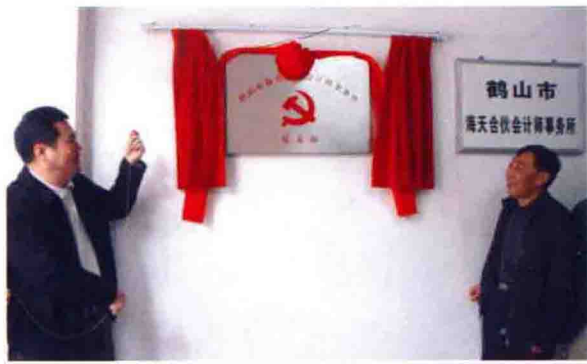
2010年1月28日，全市首家社会组织——鹤山市海天合伙会计师事务所党支部挂牌成立