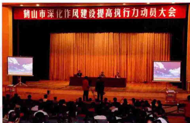
2010年4月2日，市召开深化作风建设提高执行力动员大会