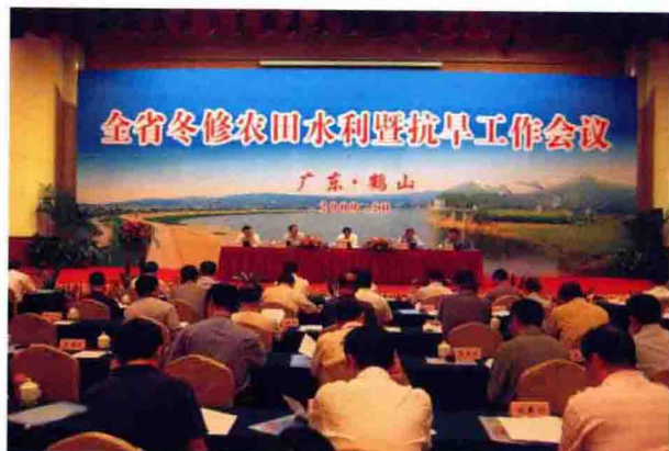
2009年10月26日，全省冬修农田水利会议在鹤山召开