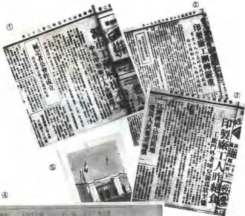
① ② ③ 当时 《文汇报》的报道 ④ 当时《生活知 识》的报道 ⑤ 戒 备森严的原中央印 制厂大门