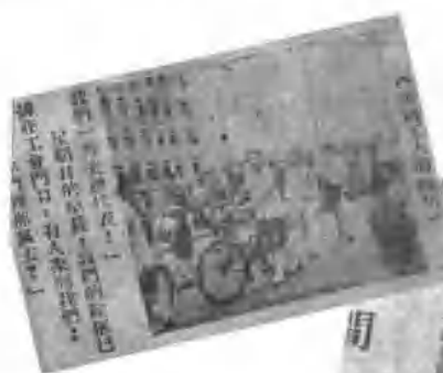
1946年6月23日五万人大游行中的印刷工人队伍