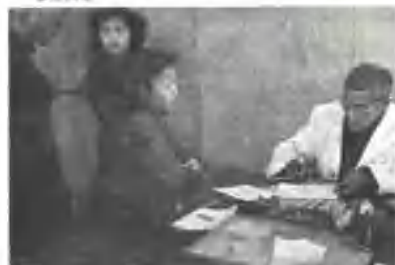
▲ 加强医疗保健工作