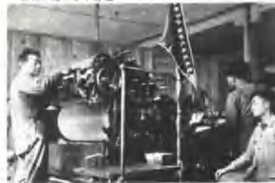
▲ 新造的中央印制厂的工人 正在全神贯注地印制人民币