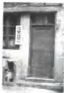
▲ 北丰报发行开设在永安街永安里1弄3号