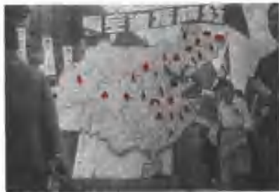
▲ 成立上海解放大游行 把红旗插遍全国