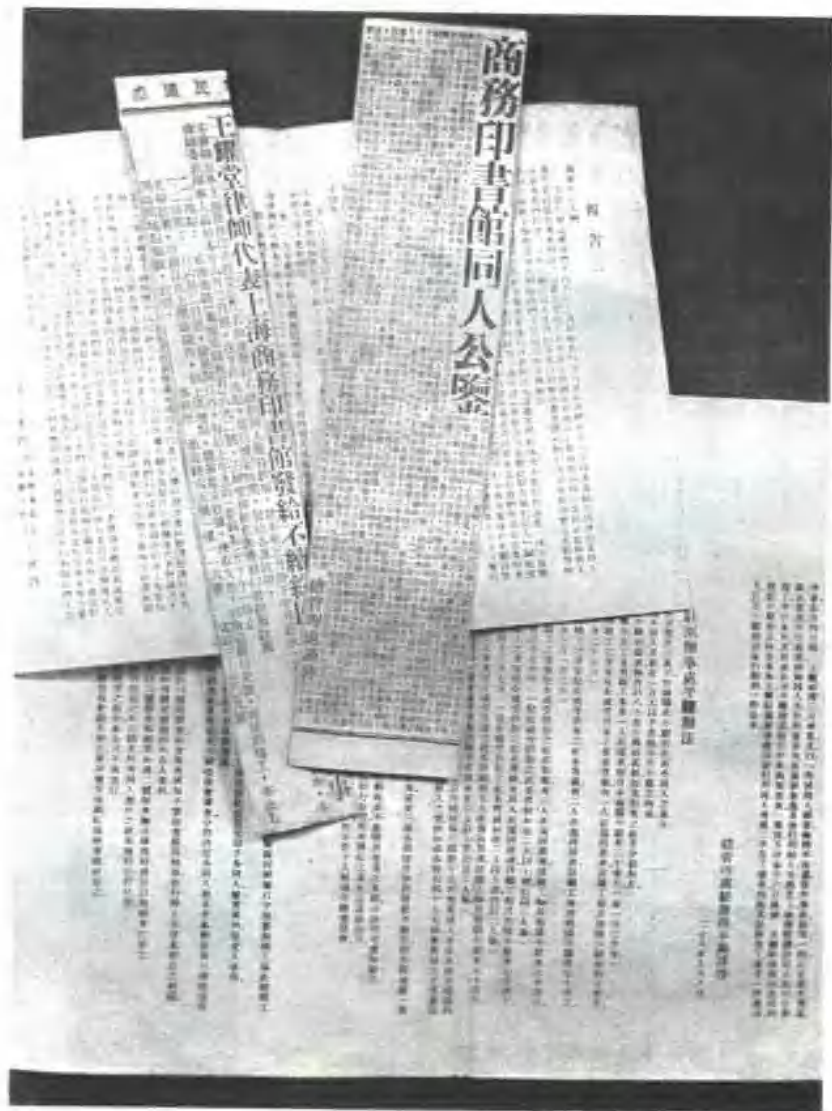
商務印書館(包括印刷廠)在抗日戰爭期間罷工爭鬥的部分材料