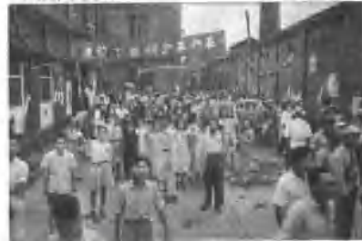
▲ 成立上海解放大游行 在共产党领导下前进