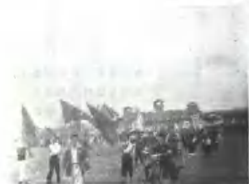
庆祝上海解放大游行中的 商务印书馆职工队伍