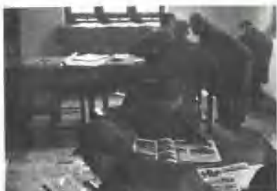
▲ 叶二同志在周总长阅读 书籍