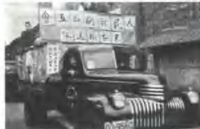
▲ 为灾区难民捐款买车