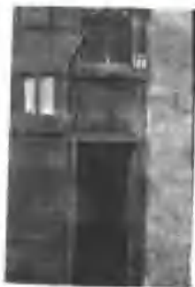
▲ 嵩山路100号是地下运输机构的一个联络点