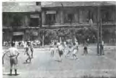
▲ 开展体育活动——进行 篮球比赛