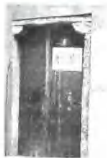
▲ 国华印刷所开设在北浙江路兴顺里8号