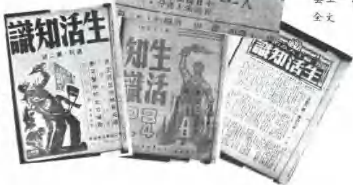
中共上海地下市委所领导的工运期刊《生活知识》