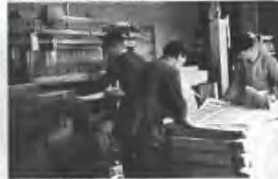
▲ 工人同志在辛勤印制 人民币