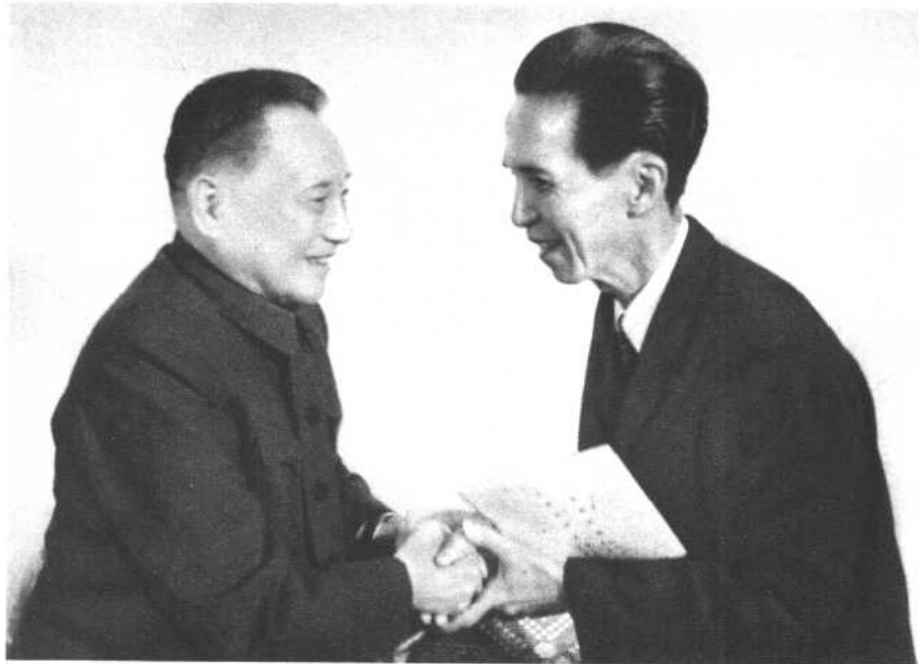
中共中央副主席、国务院副总理邓小平等同志前往越南南方共和国驻中国大使馆，最热烈地祝贺越南南方人民解放西贡的伟大胜利。