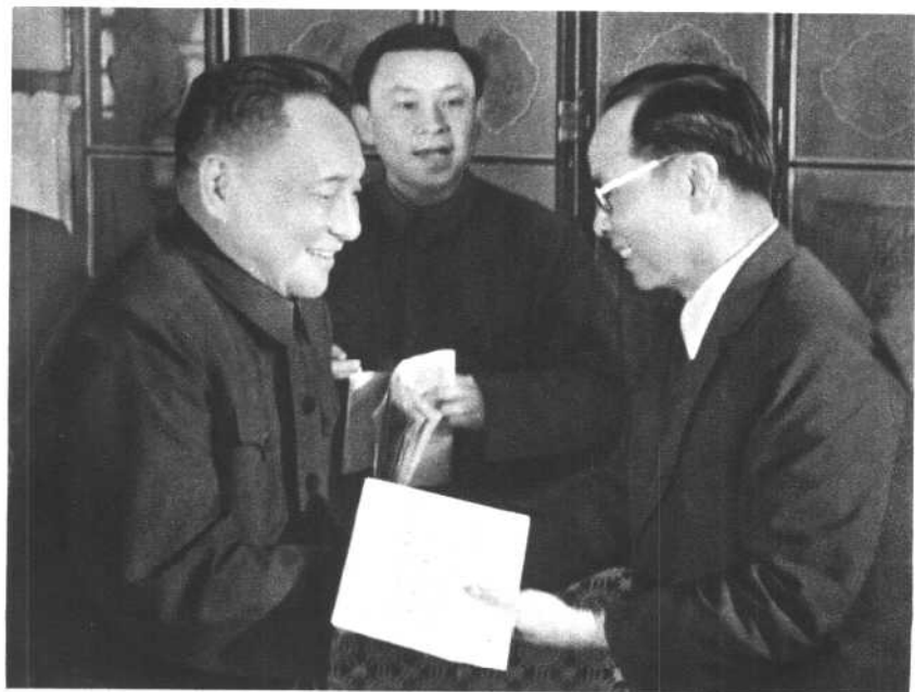
中共中央副主席、国务院副总理邓小平等同志前往越南民主共和国驻中国大使馆，最热烈地祝贺越南南方人民解放西贡的伟大胜利。