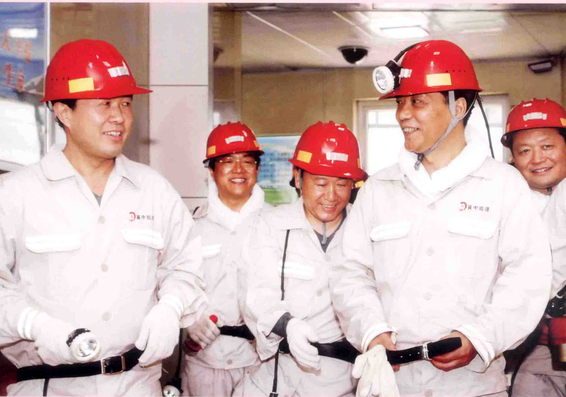
2009年6月30日，原河北省委书记张云川到邢东矿视察工作。