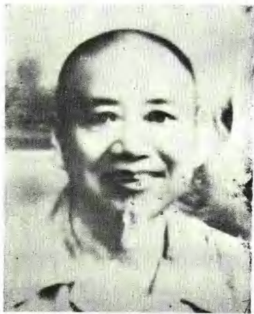
金 汤 侯 遗 像