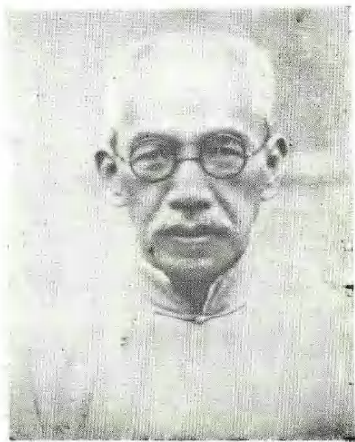
一 代 宗 师 许 寿 裳 先 生