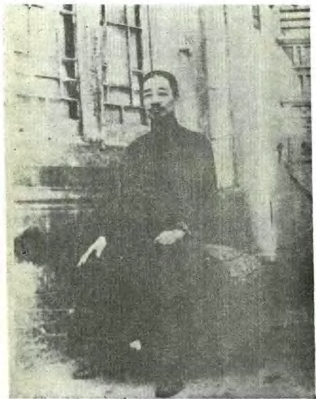
周建人一九四六年十月十九日在上海。