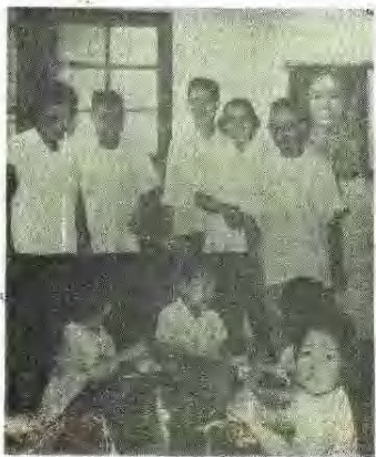
周建人同志视察舟山地区幼儿园 (一九六四年于定海)