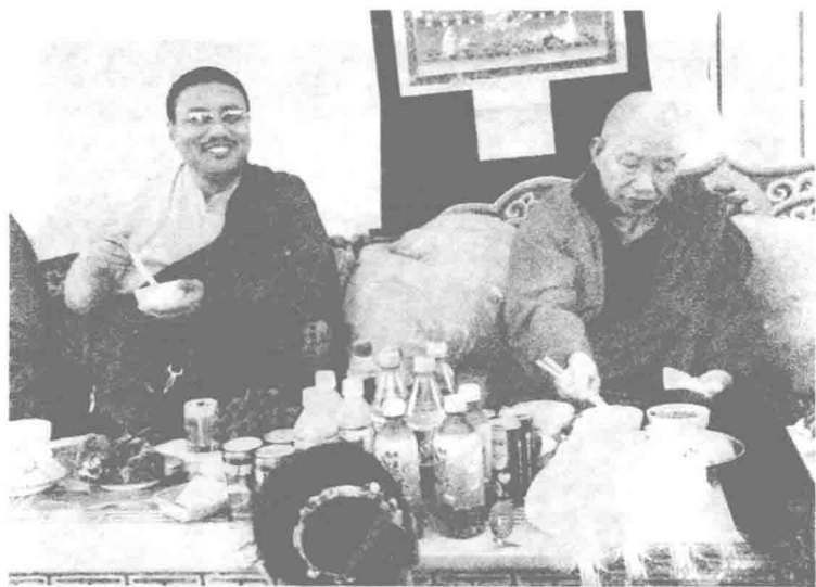
藏密至尊上师第四世多智钦·土登成烈华桑波