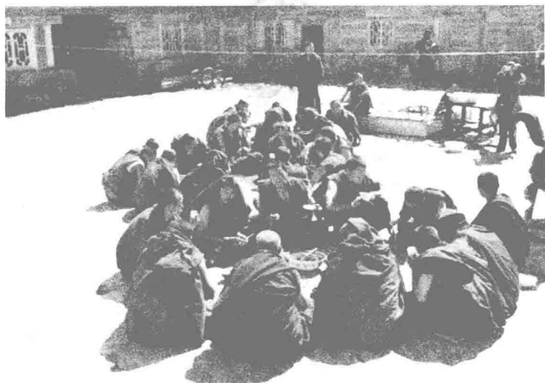
冲古寺的喇嘛在吃饭，中间是一大盆牦牛肉

虚云老和尚言：「密宗一法，经唐代一行禅师发扬之后，传入日本，我国即无相继之人」，并不承认西藏密宗是佛教的一支。