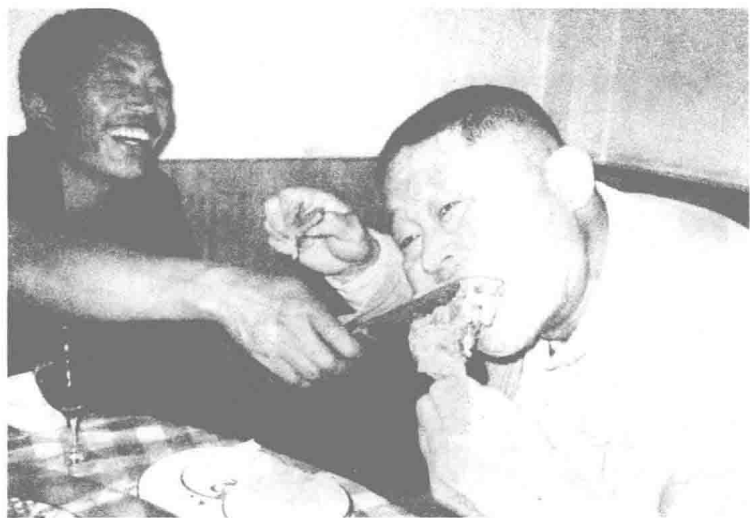
桌陀活佛请人吃牦牛肉