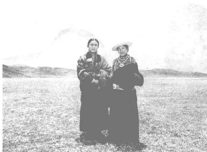
日波益西活佛和他的妻子