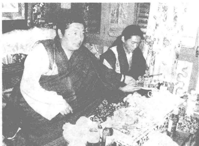
日波益西活佛与其他喇嘛在吃饭