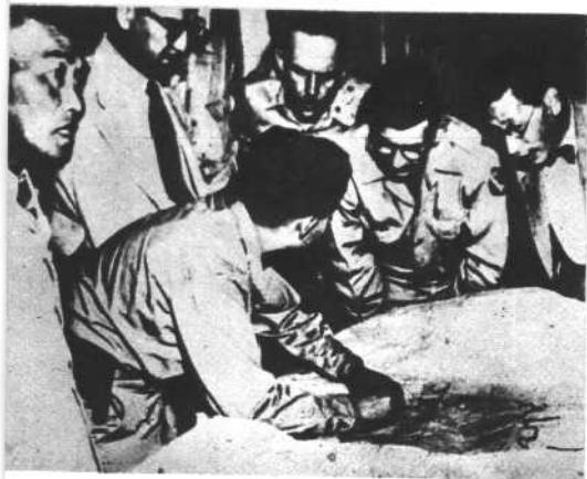
美国驻南朝鲜大使穆乔和美帝军事顾问团团长直接组织对壤阳地区的武装侵犯。(1949, 7)