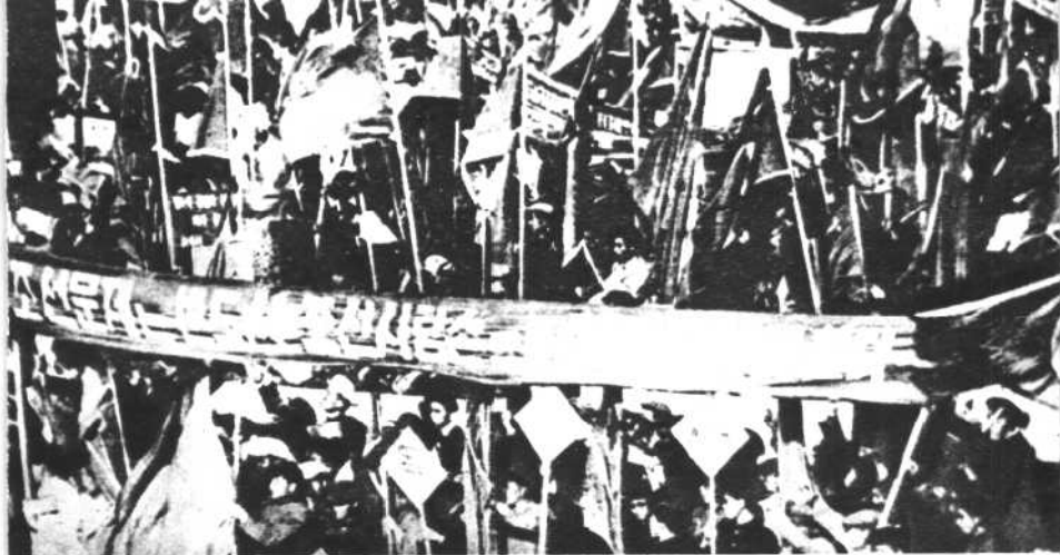
平壤市举行群众大会，热烈支持和欢迎我国政府代表团在日内瓦会议上提出的和平解决朝鲜问题的方案。（1954年）