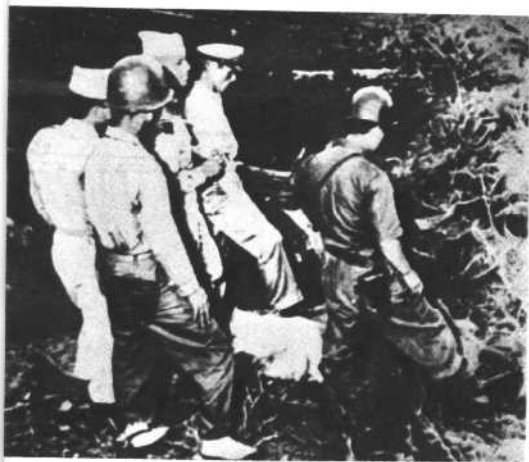
美帝侵略军顾问及其走卒在现场组织对共和国北半部的武装进攻。(1949, 8)