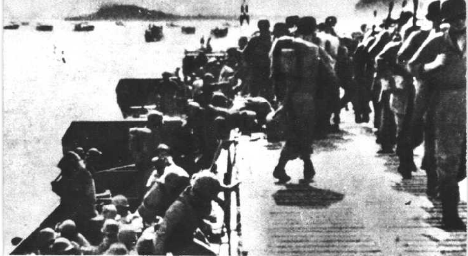
美帝侵略军披着“解放者”的外衣，爬进了南朝鲜。

一九四八年五月，美帝侵略军为镇压反对南朝鲜单独“选举”的人民，布满森严的警戒网。