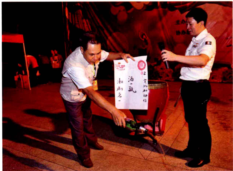
五彩缤纷的花色谜吸引广大猜众