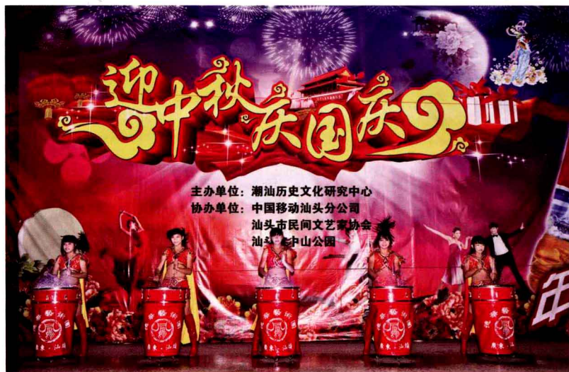
汕头市德华学校的水鼓舞表演猜一潮汕艺术名称