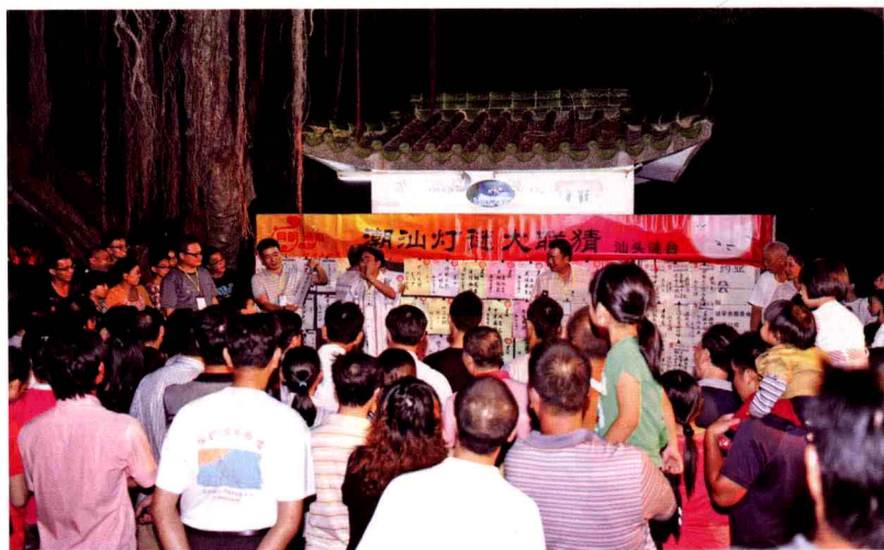
潮汕灯谜大联猜之汕头谜台