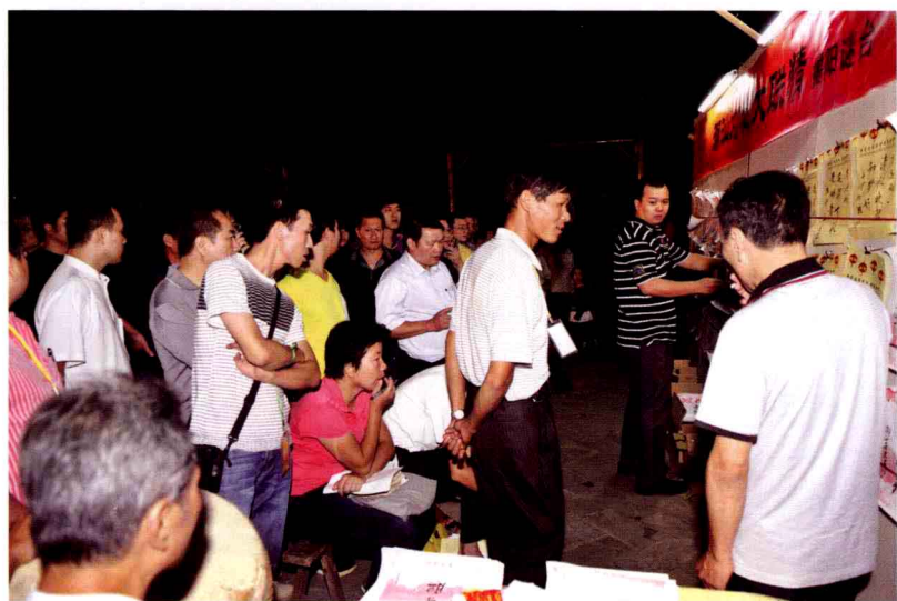
潮汕灯谜大联猜之揭阳谜台