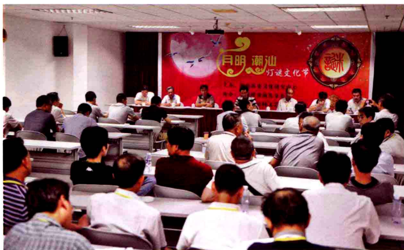
主题为“汕潮揭一体化与潮汕灯谜”的灯谜论文研讨会