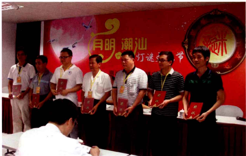
笔猜优秀射手奖得主