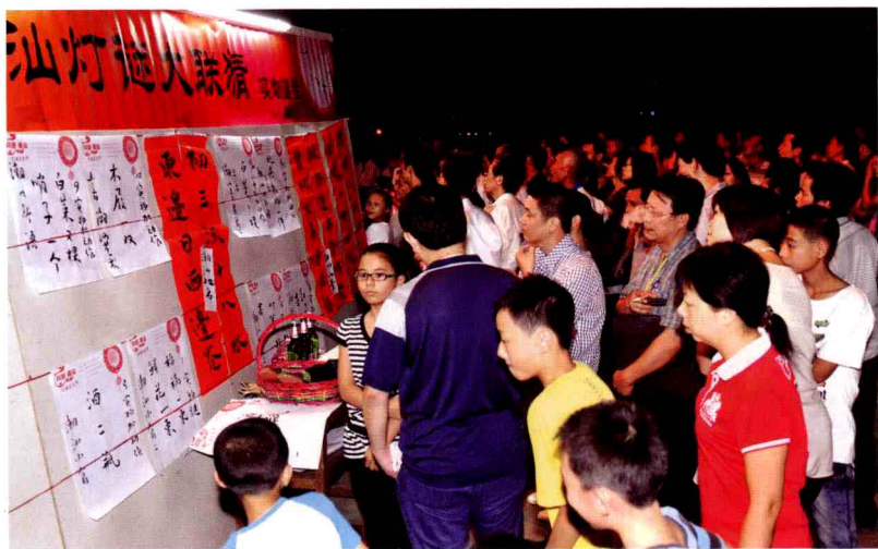
潮汕灯谜大联猜之实物谜台一角