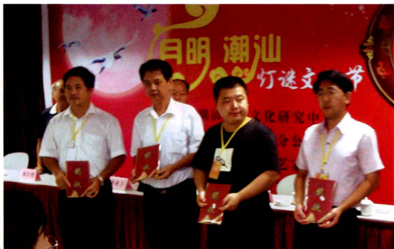
部分优秀论文奖得主