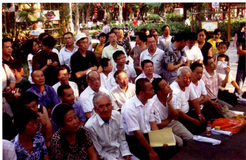
文化节的“游园联欢谜会”于10月2日至7日每天下午在中山公园举行，吸引了众多游客