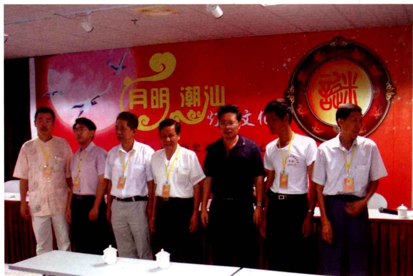
部分命题创作奖得主