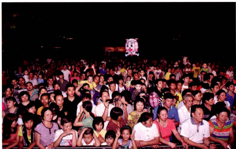
一堵堵人墙看戏猜谜