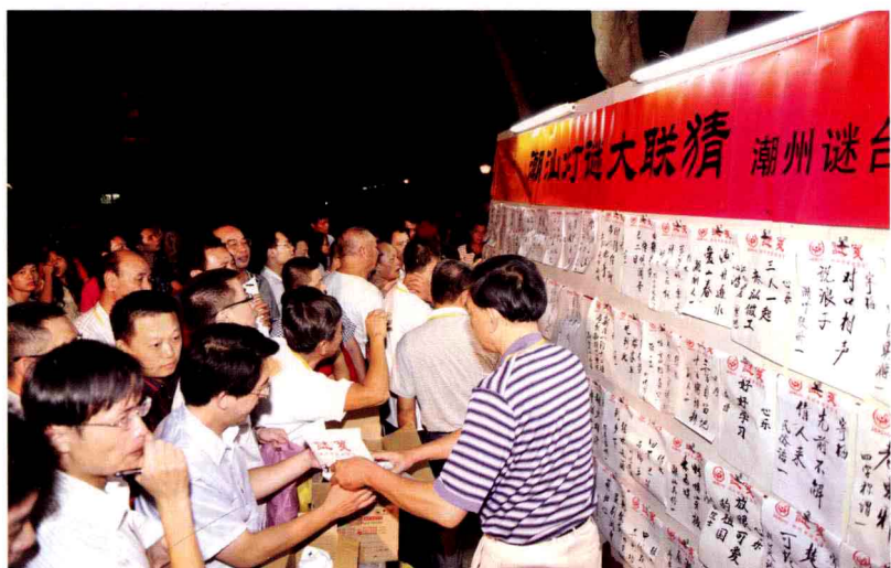
潮汕灯谜大联猜之潮州谜台