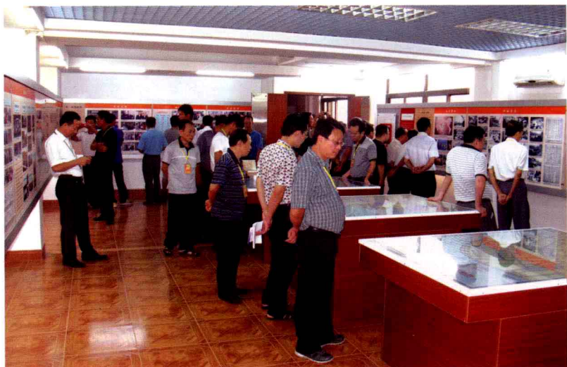
与会嘉宾谜友参观侨批文物馆