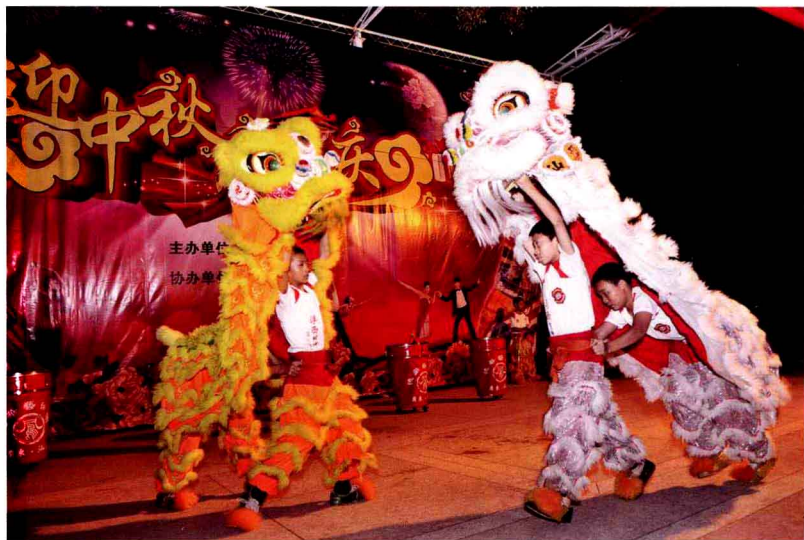
汕头市浮西小学学生醒狮队表演节目猜灯谜