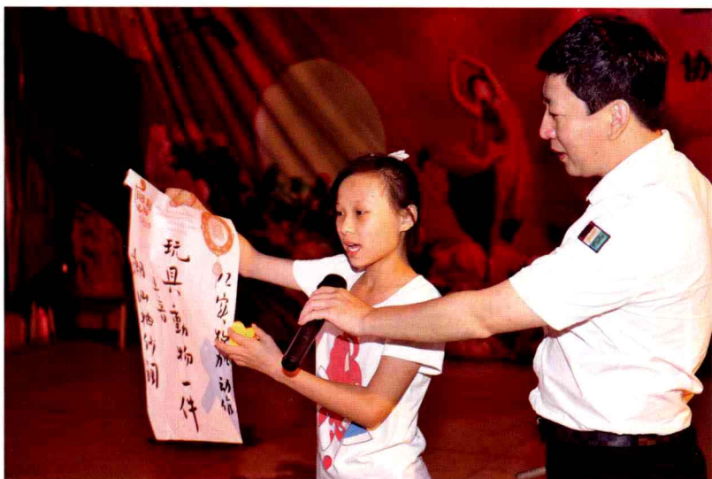
女孩子猜谜不后人