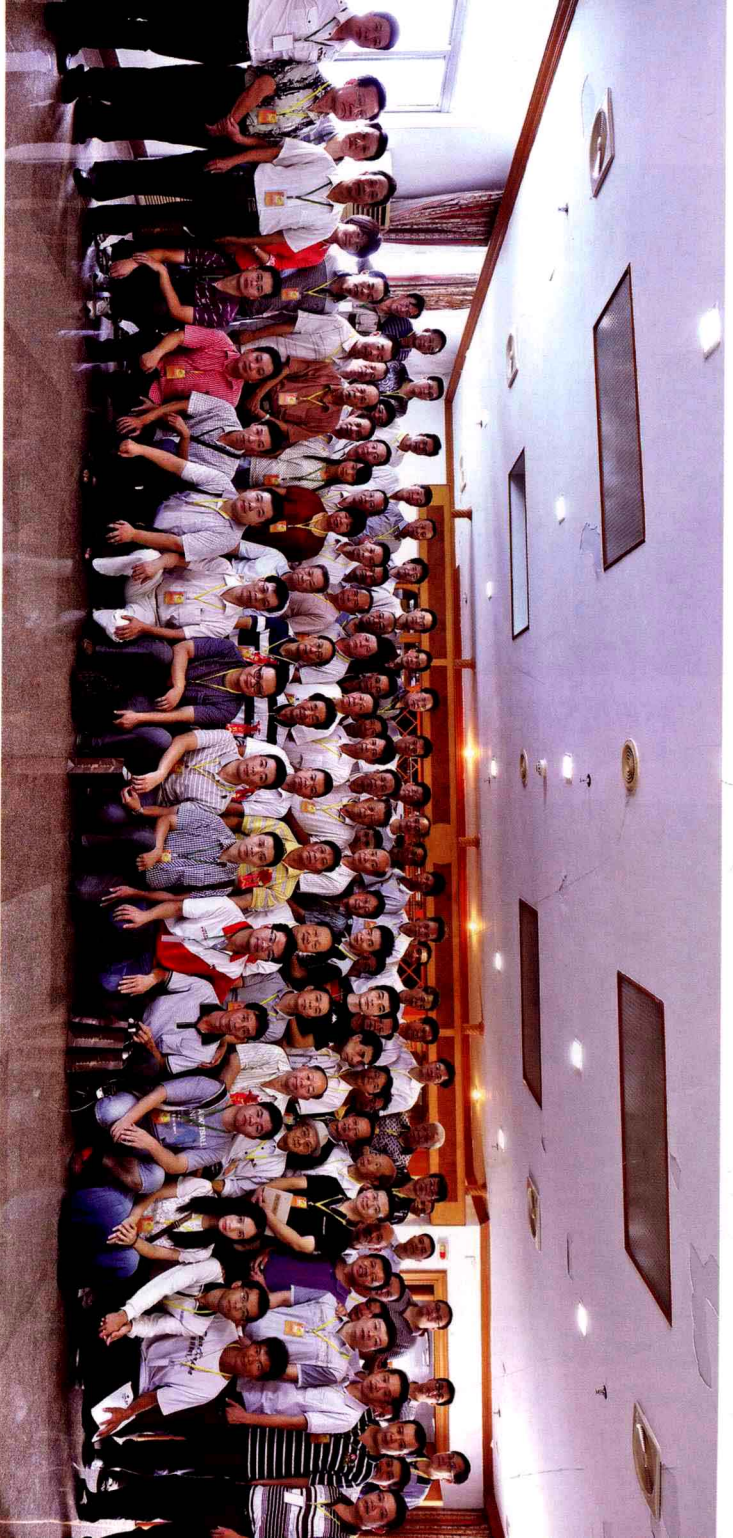
“月明潮汕” 灯谜文化节与会嘉宾谜友合影留念