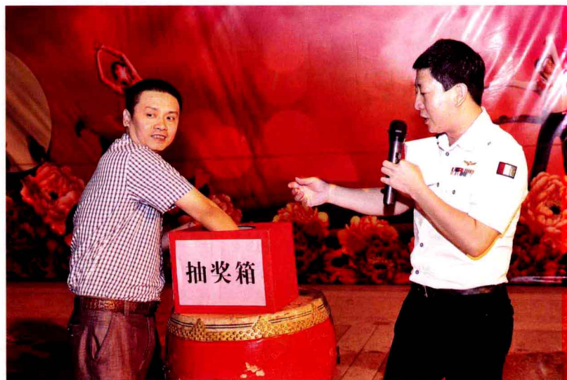
汕头移动“猜潮汕文化，抽五千元大奖”手机短信竞猜获奖者产生