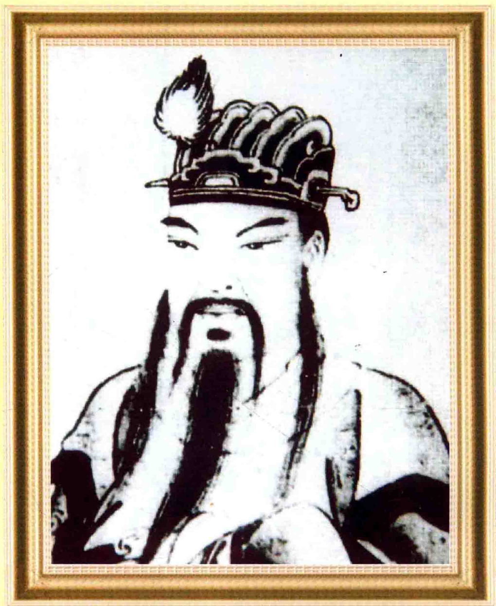
李姓开姓始祖利贞公像