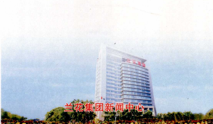
兰花集团新闻中心