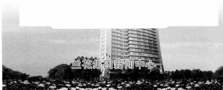
兰花集团新闻中心