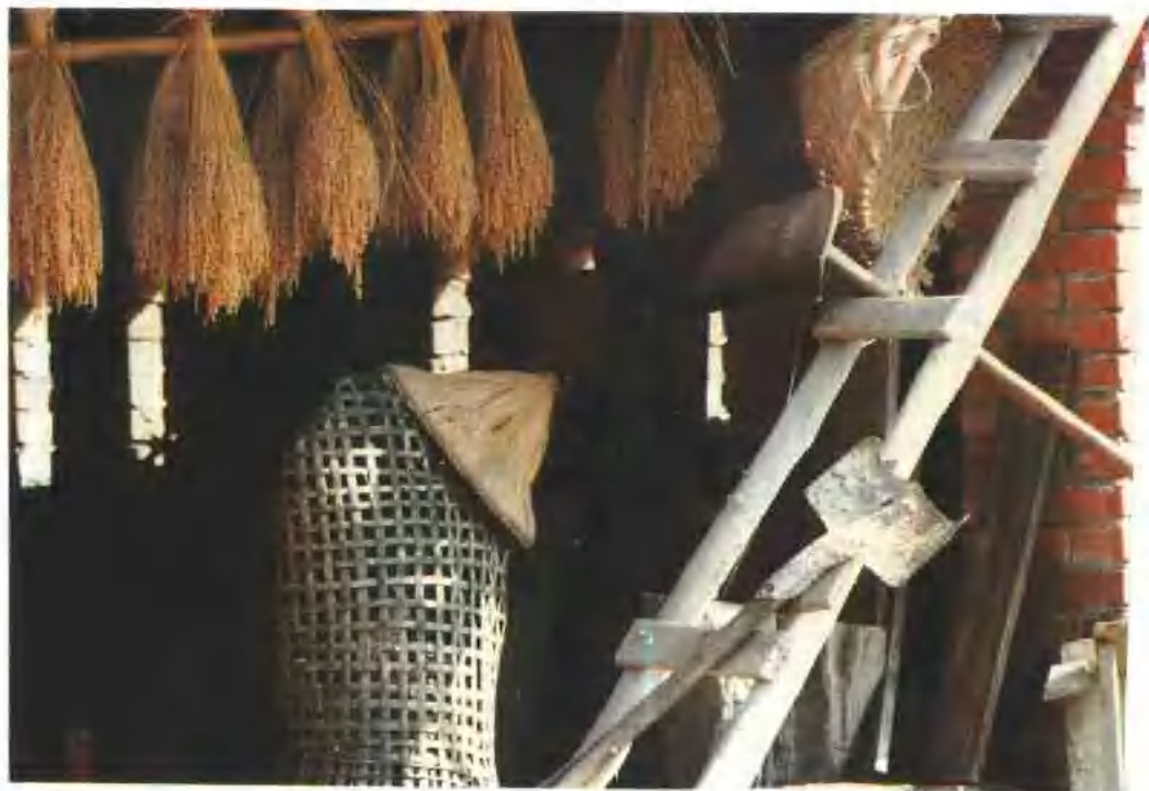
高高掛起的小米種子 零亂的農具，使寒夏博 的農舍溫馨可人 南庄榔南江村東江新 的新生代