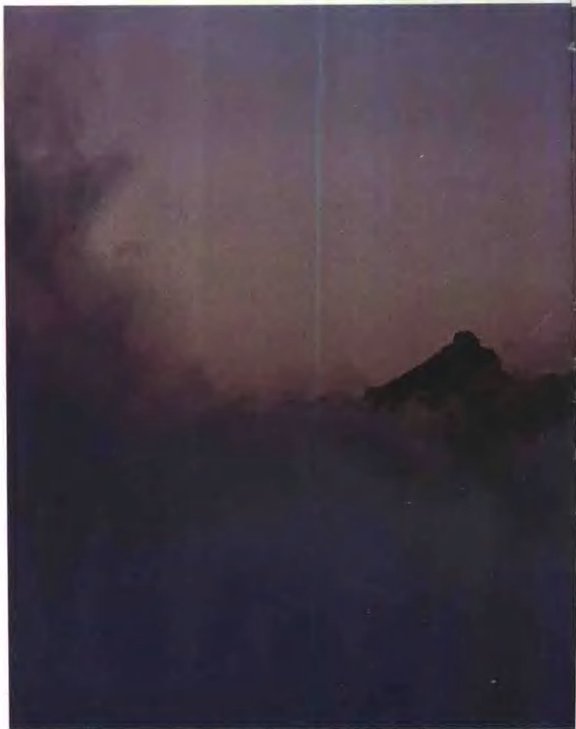
台灣山地各族山胞中，北部泰雅族及賽夏族傳說中祖先的起源都來自苗栗縣境的大霸尖山，海拔——