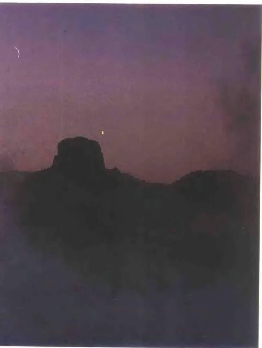
高度3505公尺，被登山界稱為三尖之一