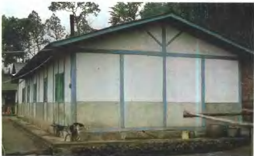
東河村中加拉灣 吊橋上的賽夏民宅 東河村內工寮小 築，在晨曦中別有 一番風貌