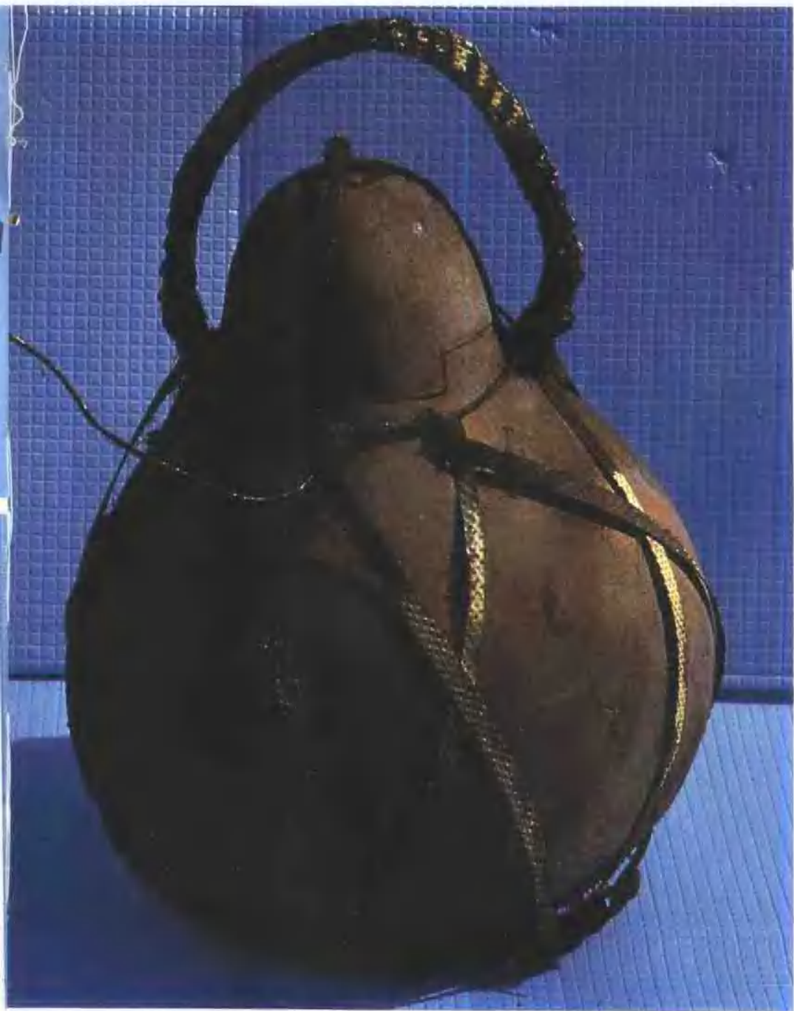
有壺蓋的葫蘆瓜成爲盛酒裝水的容器，是上山工作必備的行頭