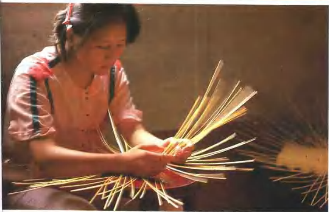
南庄鄉公所家政班婦女們擅長於竹製品編織，近年來正大力推廣中