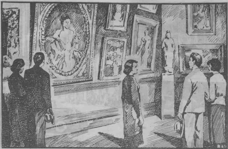
( 2 ) 陈列室里展出的美术品，吸引了不少艺术爱好者。