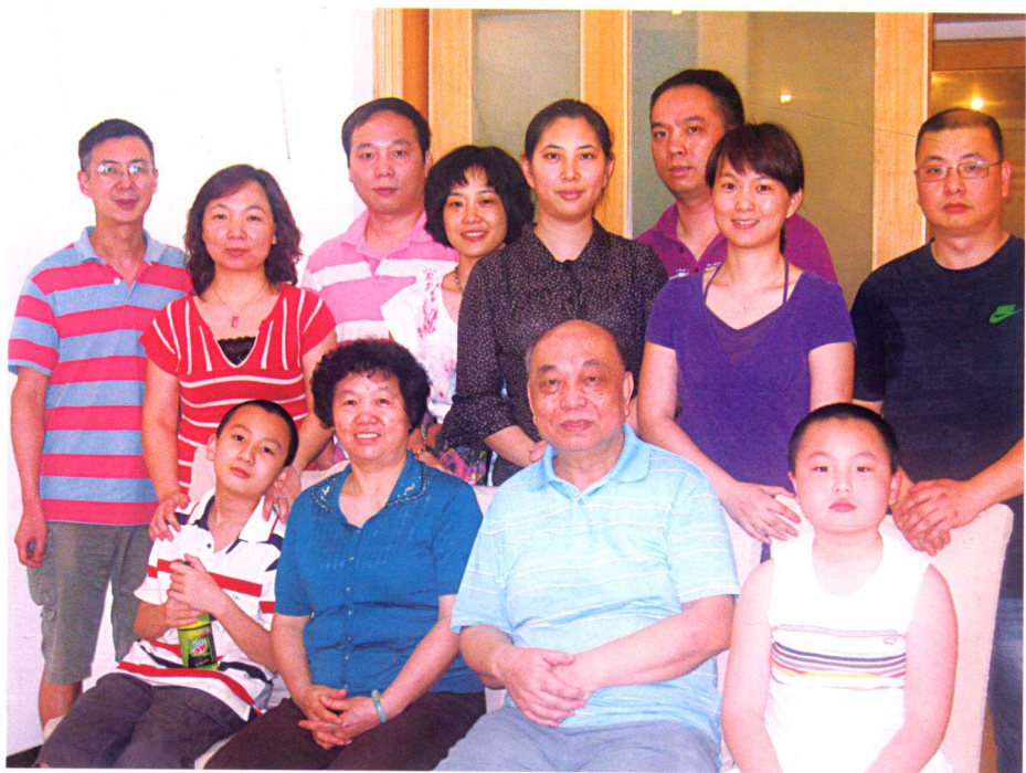
七十五寿辰家人祝贺