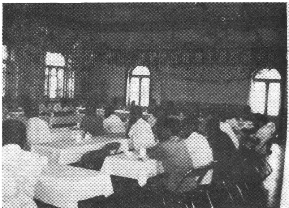
热辽地区党史工作座谈会会场