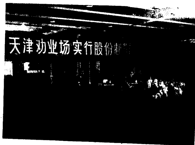
天津市劝业场“实行股份制暨股票发行”新闻发布会。

主要措施 (1)坚持应时到节、精心安排市场与积极引导、调控市场相结合。在元旦、春节、夏令市场,中秋、国庆市场分别投放货源17.39亿元、8.55亿元和8.95亿元,比上年同期分别增长18.18%、11.6%和9.26%。同时国合商业根据需要,还突出了经营特色,恢复开辟了207个名店和特色商店,兴办了71个早市、夜市、周末市场,适时延长营业时间,受到消费者的欢迎。(2)坚持以市场为导向,开拓市场与部分商品计划收购、分配、调拨相结合,扩大了商品购销。1991年,列入计划分配调拨的化肥、农药、农膜、粮食、棉花、鲜蛋、铅丝、元钉等商品,均超额完成购销计划。先后成功地举办了春、秋两届商品交易会,分别成交26亿元和36亿元。一商局仅7个站就派出3万人次,分赴全国各地推销商品9.3亿元,催回货款14亿元。全年出口商品有97种,出口总值实现1.1亿元,增长15.3%。(3)坚持改革与发展相结合,转换内部机制,建立联营、联销、连锁商店,发展企业集团,批发企业尤其是大中型批发企业,实行进销合一,划小核算单位,责任落实到人,在调整经营策略、改变经营方式中,建立起新的进货渠道和双向销售网络。一商局7个站新建立了430多个业务联营、联销、购销网络,使连续两年亏损的几个站,在当年进货销售的商品中,实现盈利近3000万元。(4)坚持两个文明一起抓,政治与业务相结合。全年先后对5.2万名职工进行了各种形式的岗位培训,使广大商业干部职工队伍的政治素质和业务素质有了进一步提高。全年共收到表扬信8000余封,涌现出106个经济效益显著单位,21个优秀领导班子,90名优秀领导干部,83名优秀营业员。