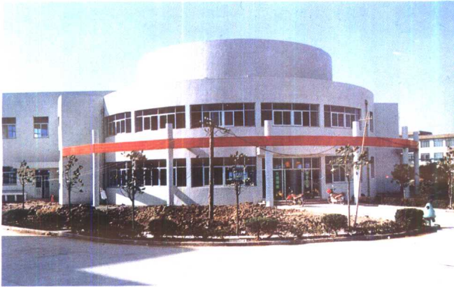
2. 工读学校新建的多功能厅