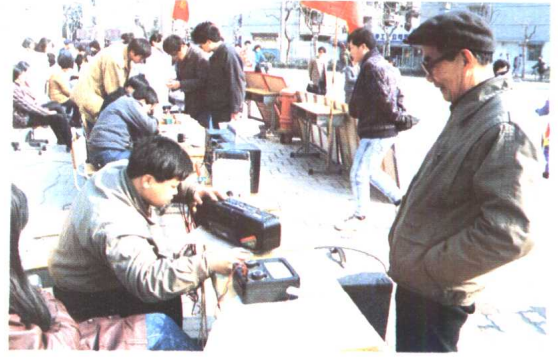
1. 群星职校师生“为民服务”活动