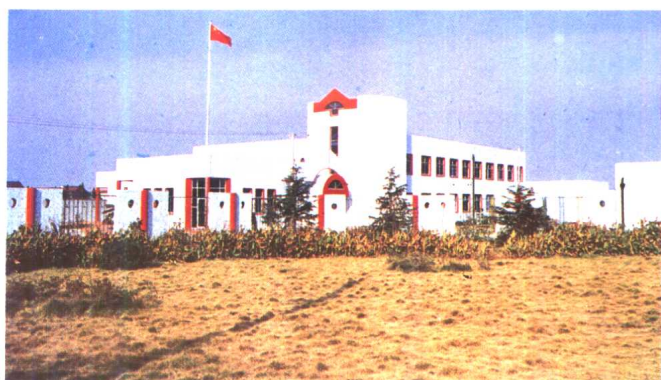
5. 张江镇新盛村投资改建的求知小学