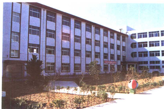
3. 香港企业家邵逸夫先生捐资建造的逸夫小学