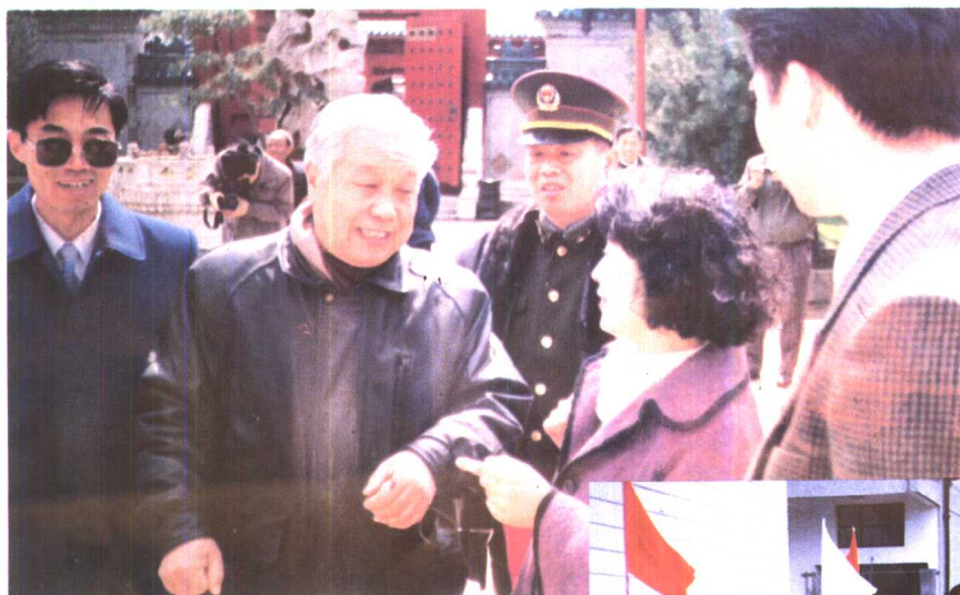
5. 公安部领导视察“金盾” 保安人员培训中心