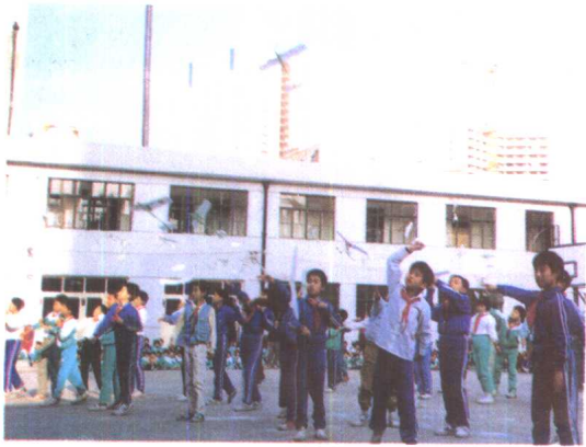
6. 七号桥小学学生的空模表演