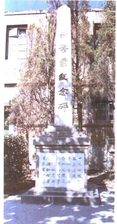
3. 浦东中学五卅惨案纪念碑