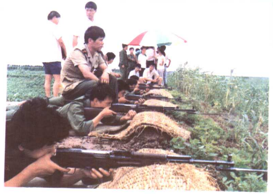
9. 高桥中学学生参加军训活动