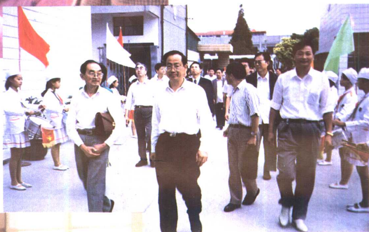
6. 国家教委副主任张天保 一行视察逸夫小学