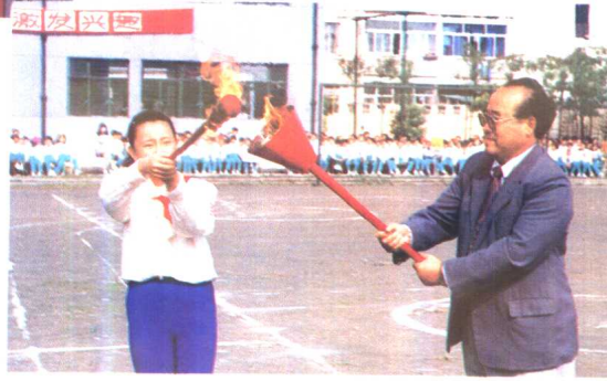
5. 雪野新村小学举行科技节活动