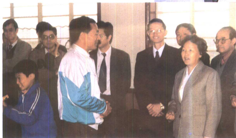
7. 谢丽娟副市长视察 浦东新区工读学校