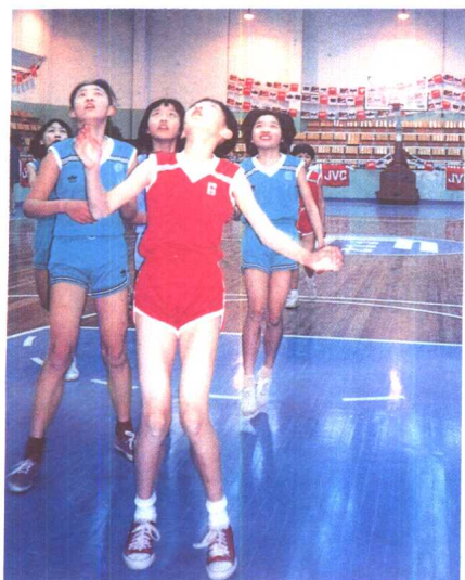
4. 保税区联合发展公司出资建造的外高桥保税区实验小学体育馆