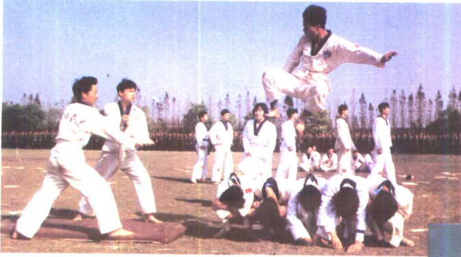
2. 警校学生比武活动