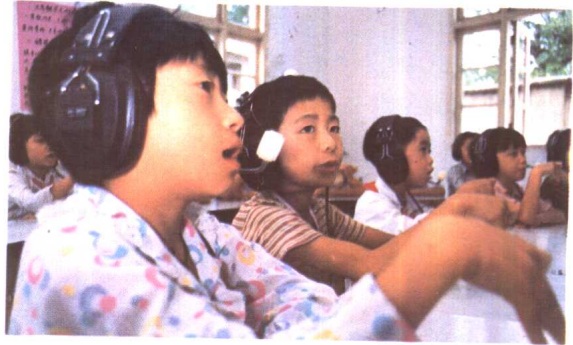
11. 高桥聋哑学校学生在接受语言训练