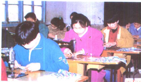
4. 北蔡中学学生上劳技课