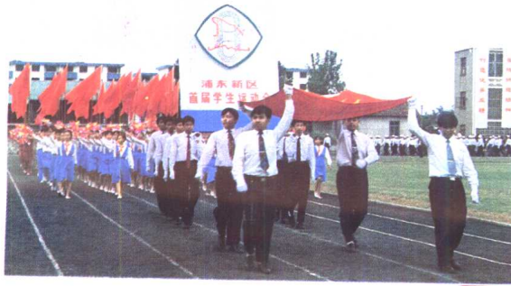
10. 浦东新区首届学生运动会入场式