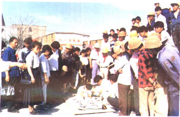
12. 民生路小学师生慰问浦东建设者