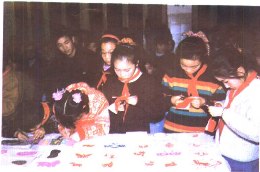
14. 梅园小学小能手献艺