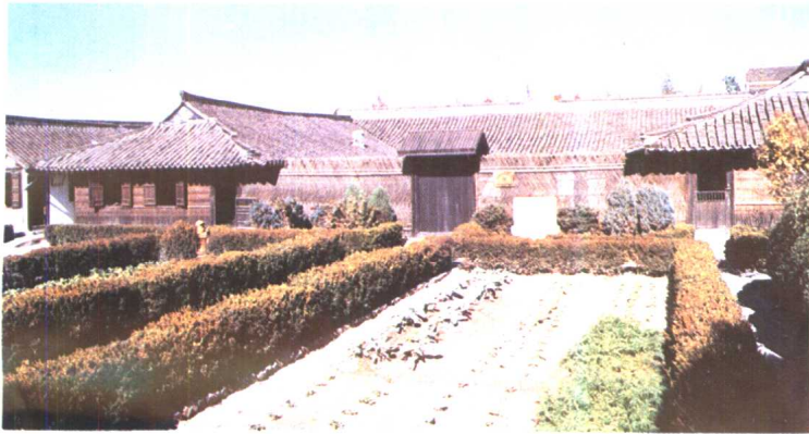
2. 张闻天故居(列为中小学德育基地)