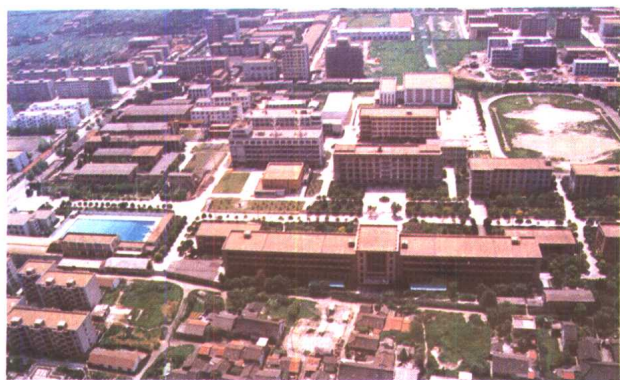
7. 上海海运学院鸟瞰