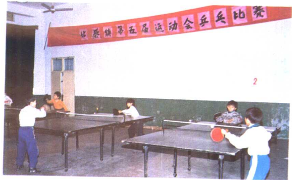
13. 乒乓是北蔡地区小学生的体育传统项目