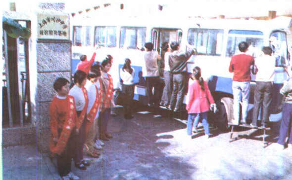
8. 川沙中学学生参加“为民服务”活动