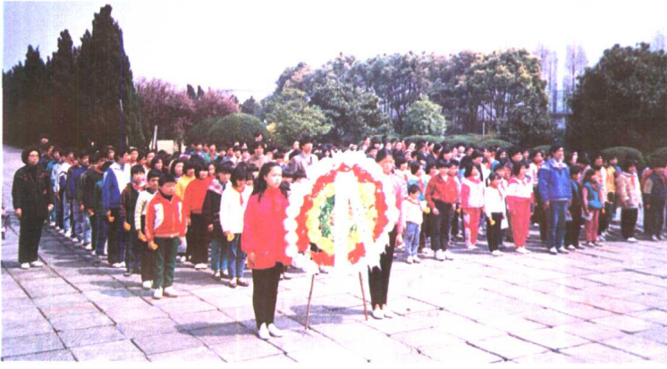
1. 学前小学师生缅怀先烈