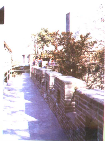
6. 城厢小学古城墙上的“文笔塔”