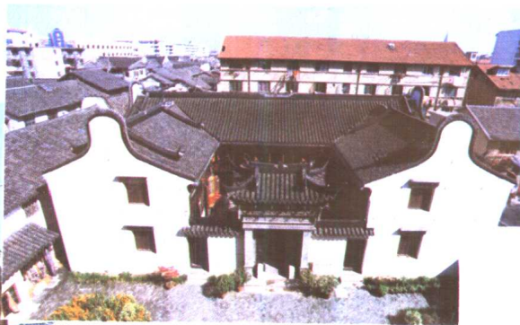
4. 座落在川沙镇的黄炎培故居 (列为中小学德育基地)