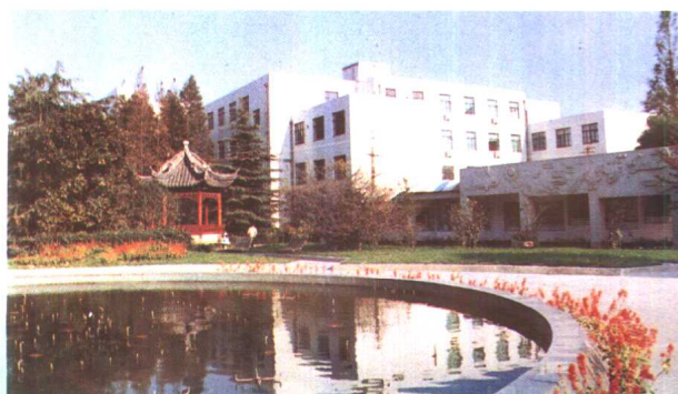
8. 建平中学校园一角