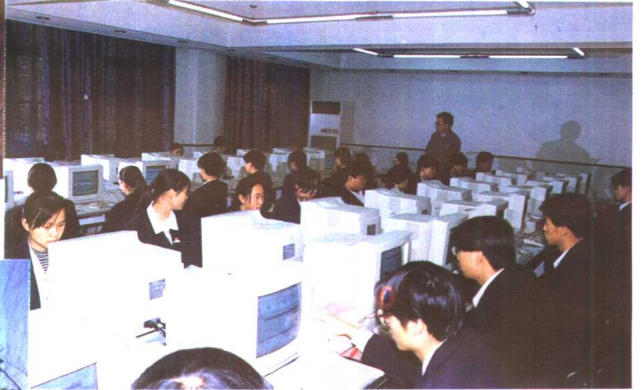
5. 群星职校计算机房