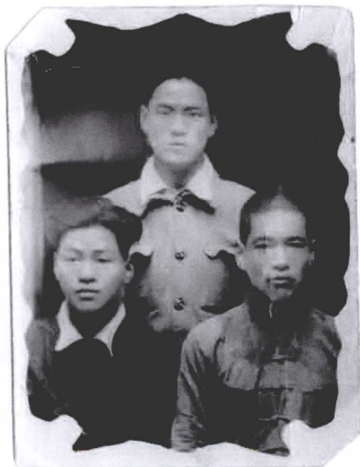
世忠、世清、世孝兄弟仨合影