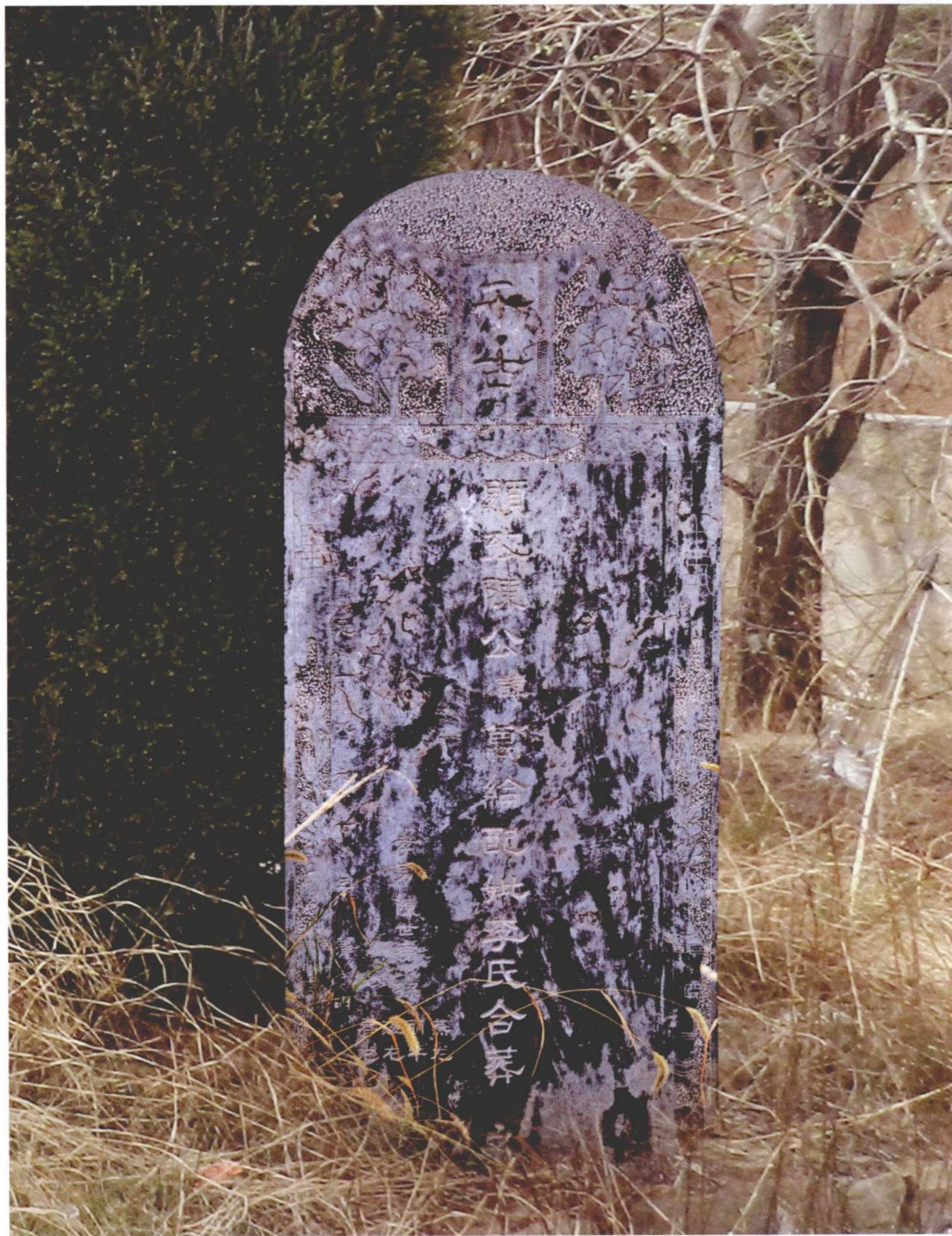
第十三代陈万纶、李氏墓碑