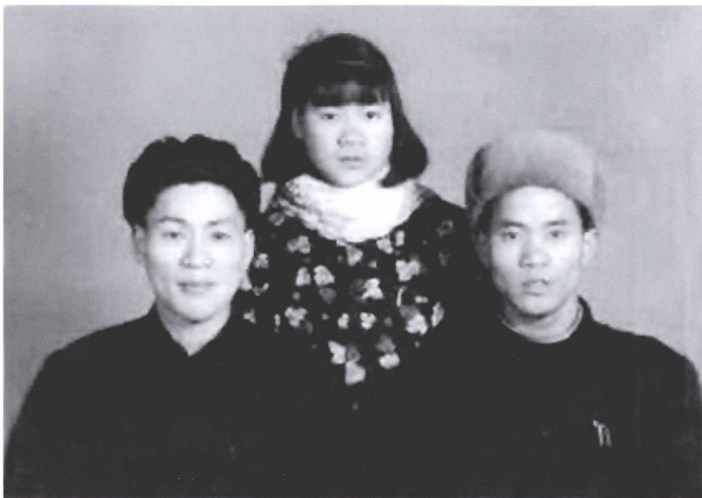
世清、世孝、世英兄妹合影