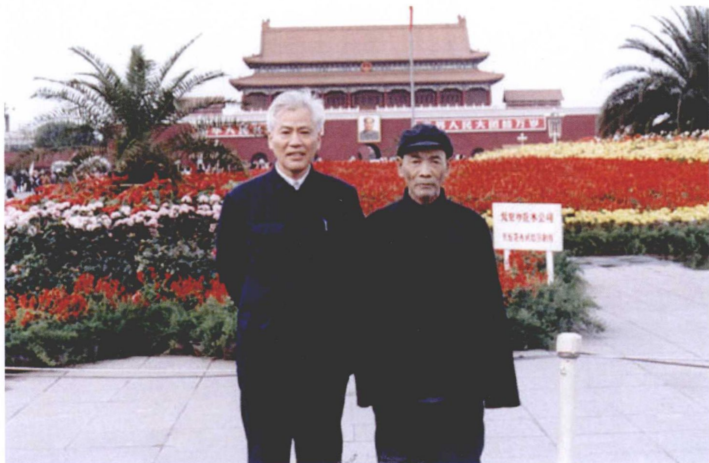
世忠、世孝哥俩在北京