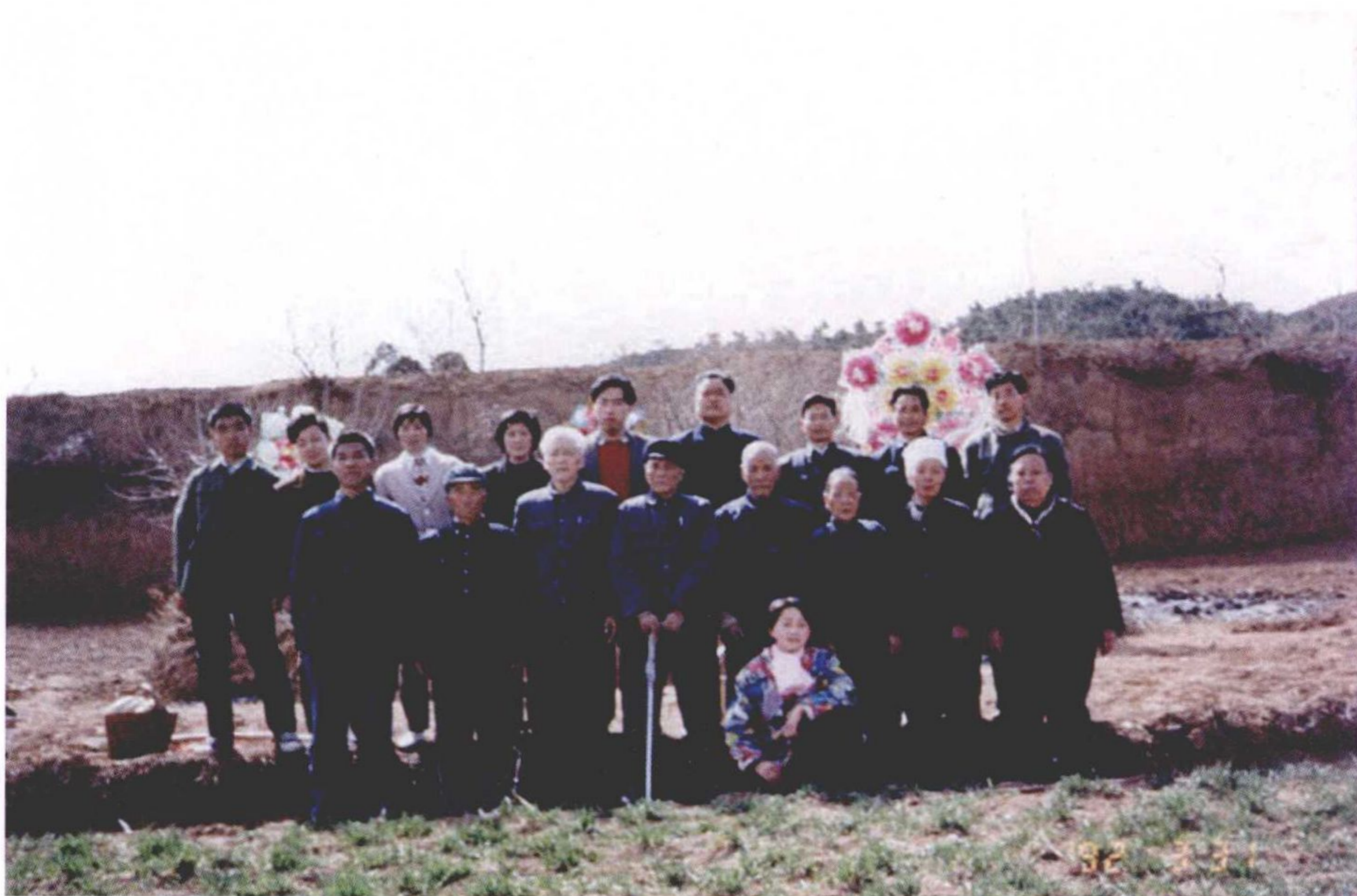
陈氏第14、15、16代在沟东坟上留影