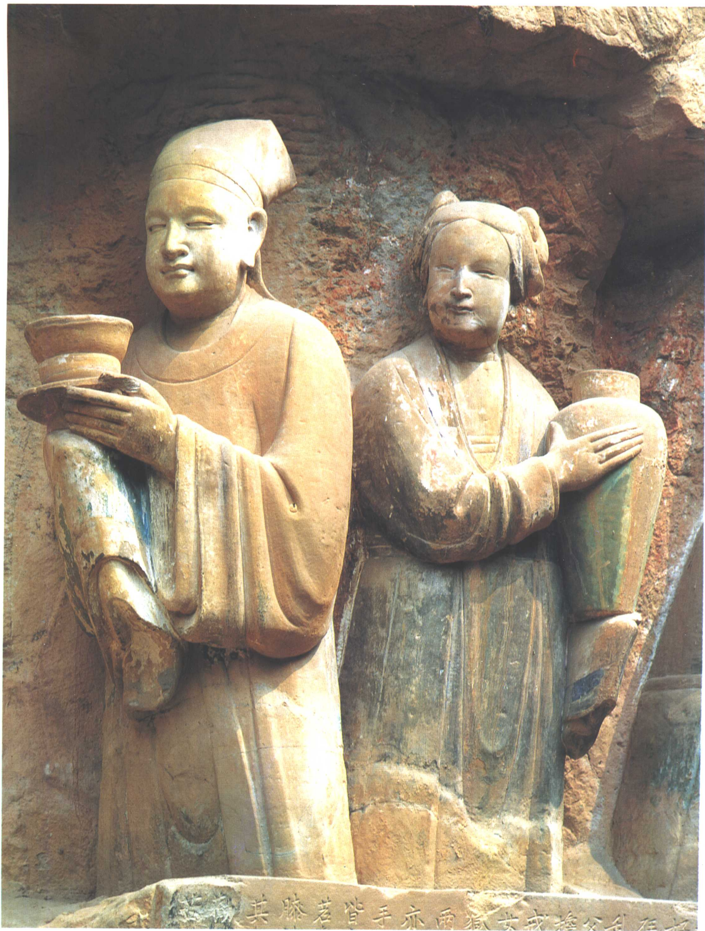
共膝若管手亦兩獄女我擔父利在杯 沽酒男女 [南宋]