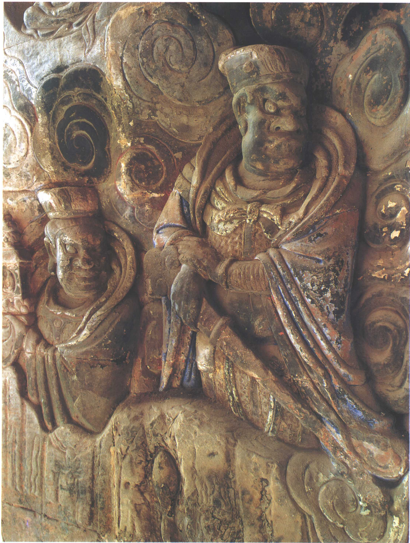
毗卢庵外壁雕像 [南宋]