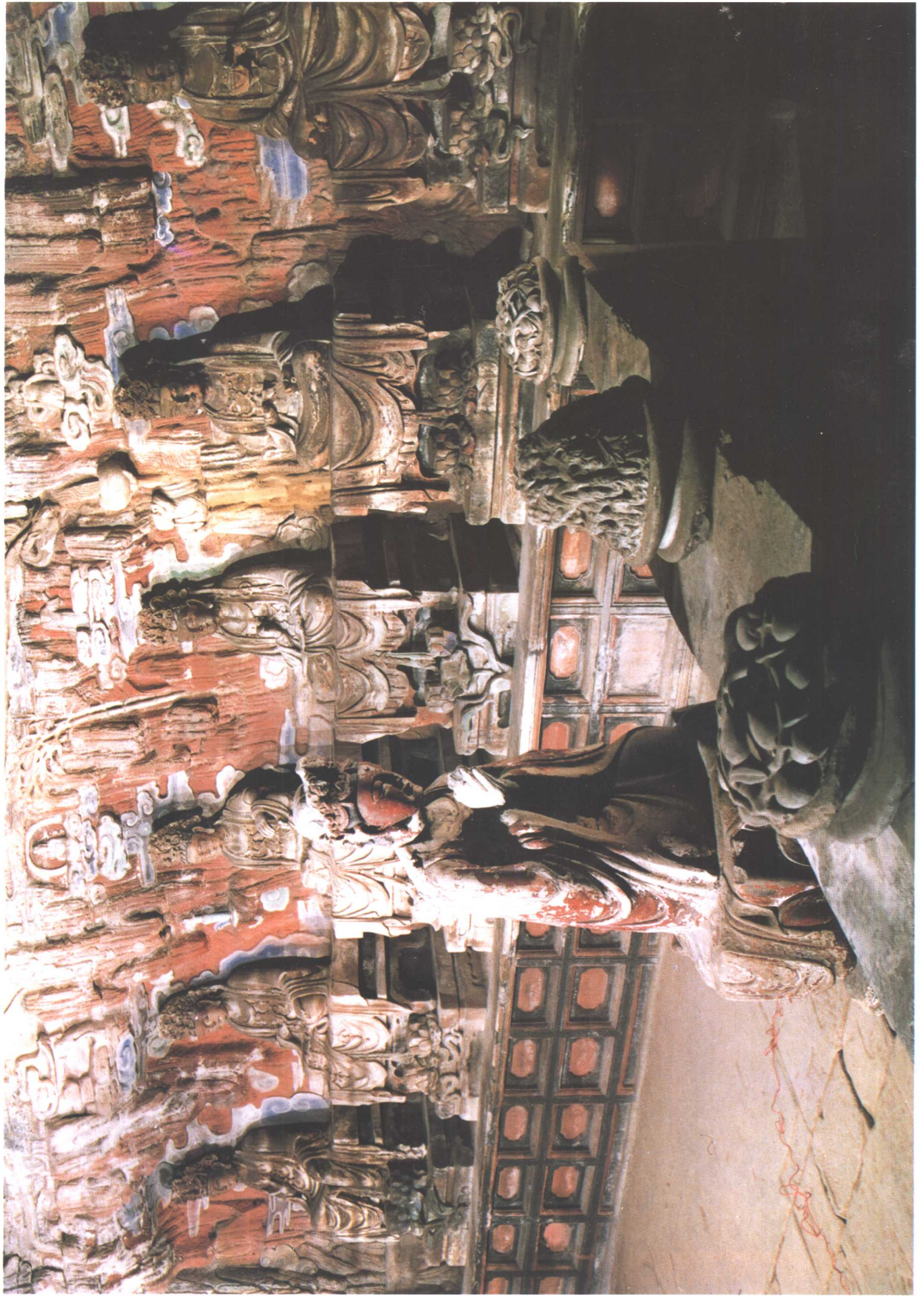
圆觉道场局部 [南宋]