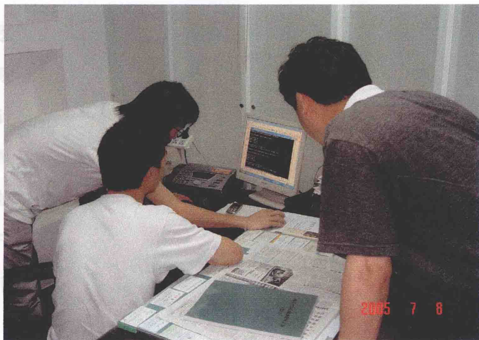
现场解决网络问题

7月8日下午，计算机系社会实践小分队一行考察参观了临安市牙病防治所，所长热情的接待了我们，我们了解完牙防所的一些具体情况后，并帮所里的电脑解决了积压好久的网络问题。