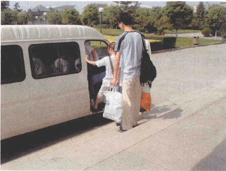
7月5日赴临安实践小分队出发去临安