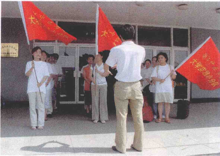
领导讲话，各小分队接受领导授旗，准备出发