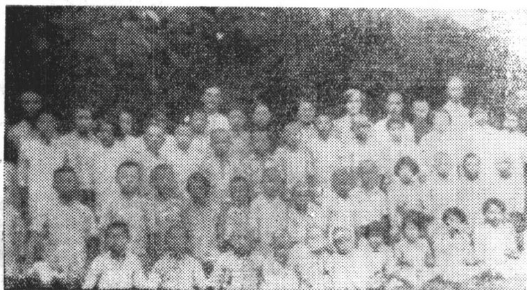
抗战剧团的工作人员在沙洋前线抢救之难童