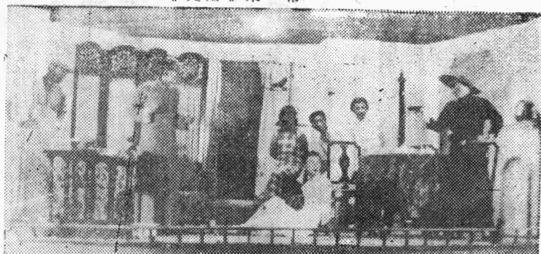
《中华民族的子孙》第二幕