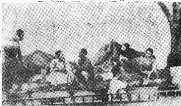
抗战剧团演出的剧照