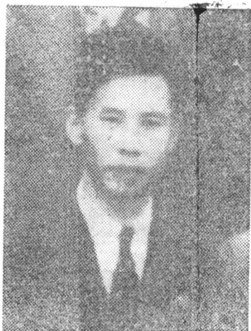
冷善远(钟纪明)同志遗像