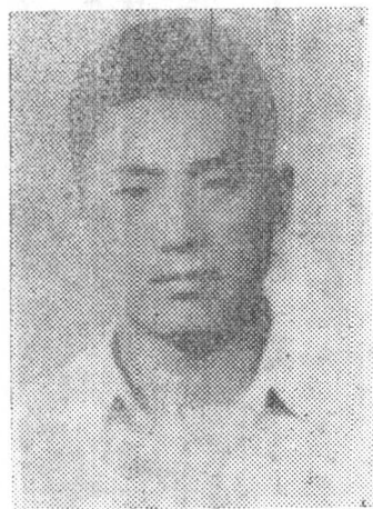
陈然(陈崇德)烈士遗像