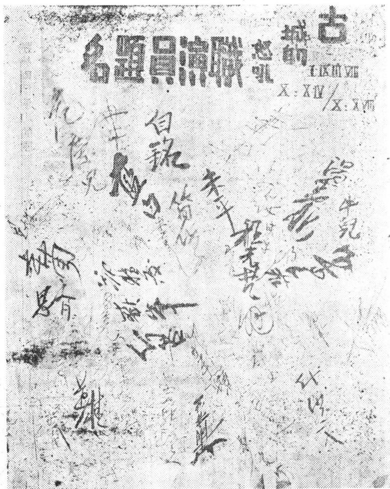
抗战剧团《古城的怒吼》职演员题名