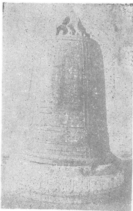
图为五公祠现在展出的铜钟