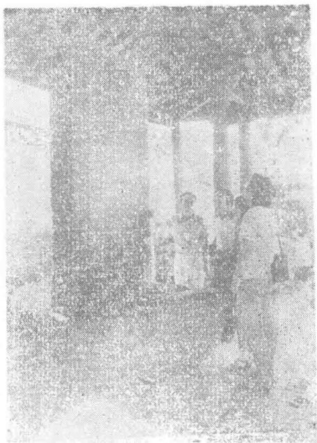
图为赵佶的神霄玉清万寿宫诏碑