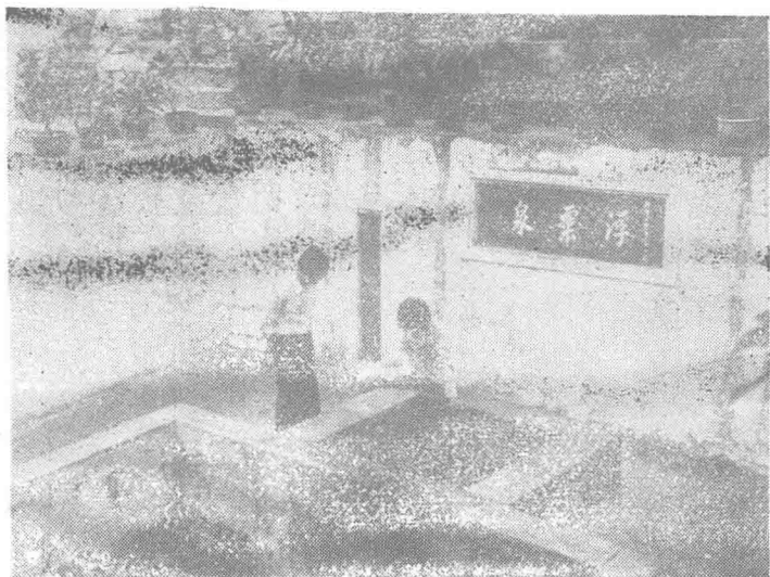
图为浮粟泉，泉边有洞酌亭

苏轼借寓此地金粟庵时，他指凿的双泉，其味甜美，水源旺盛，水面常浮小泡，类似粟粒，因此，后人题名为“浮粟泉”。这个泉与其他井泉有所不同，当时郡守承议郎陆公饮泉水后，赞其泉水甘甜，乃于井山筑一亭，常在亭上品茗，但缺其铭。苏轼居琼三年之后，在奉召北归途中路过此地，陆公邀苏轼在亭上品茗赋诗，并将该亭命名为“洞酌亭”。