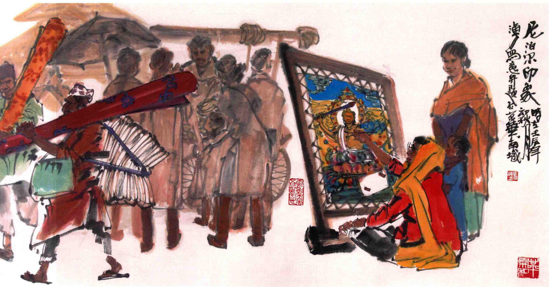
尼泊尔印象 Impression on Nepal