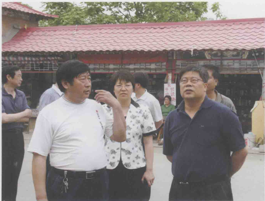
平谷区委书记邱水平调研创卫工作