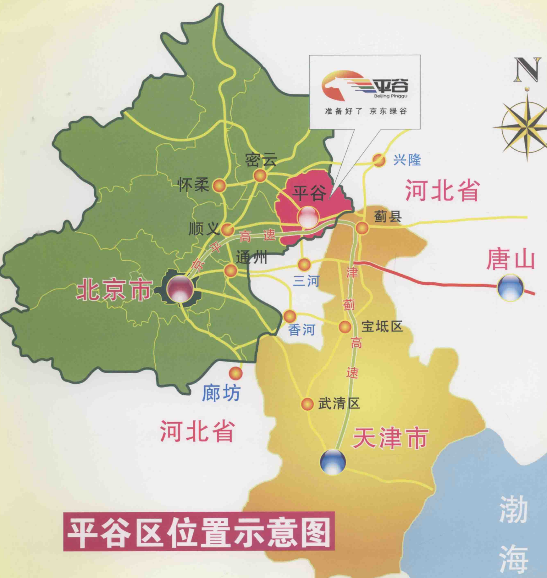
平谷区位置示意图