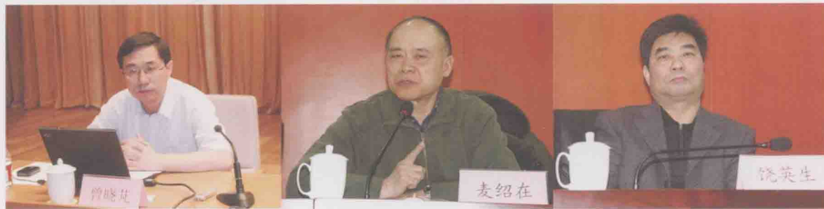
北京市爱卫会专家参加平谷区 创建国家卫生区技术评估通报会