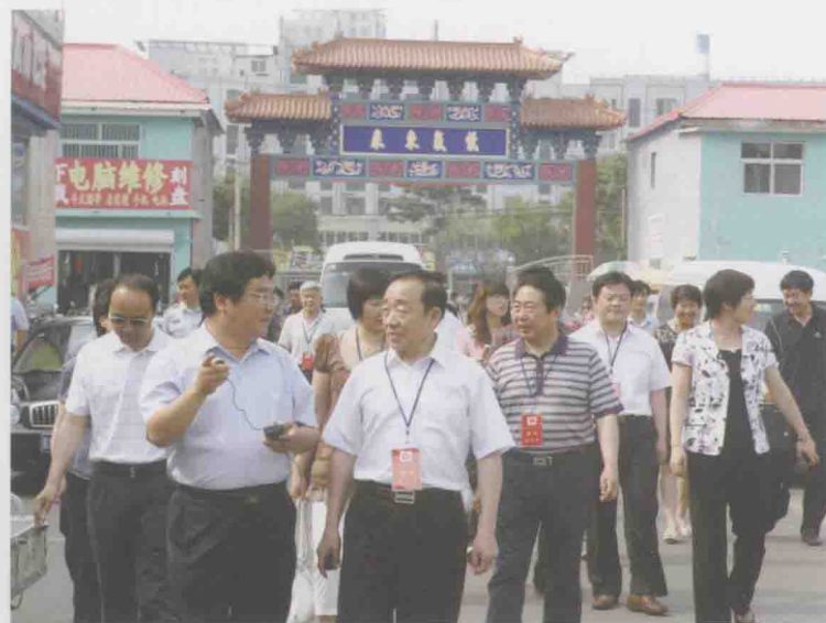
平谷区政协主席王春辉调研创卫工作