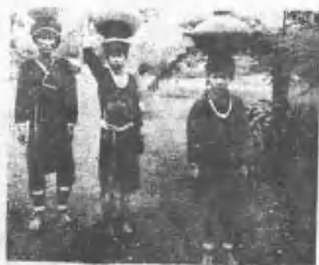
《縣蓮花》水蓮之族美阿社密奇