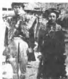
社內村義來縣東屏 裝盛女男族圖排