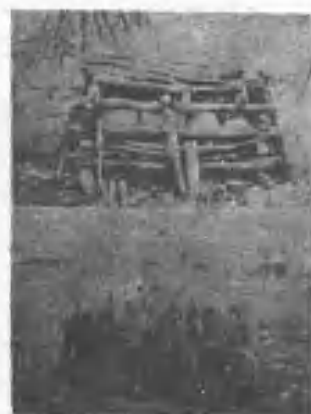
雅美族土器之燒製