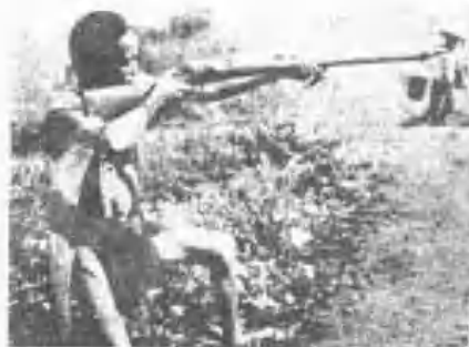
華蘭槍步之子男安考利馬族亞泰