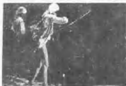
《社瑞卡斯》魚射之族雅季