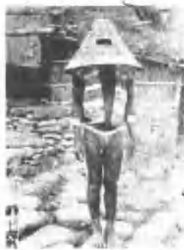
帶字丁與帽銀之子男族美雅