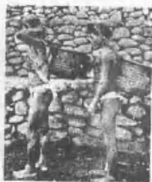
畢美族男人之背篋