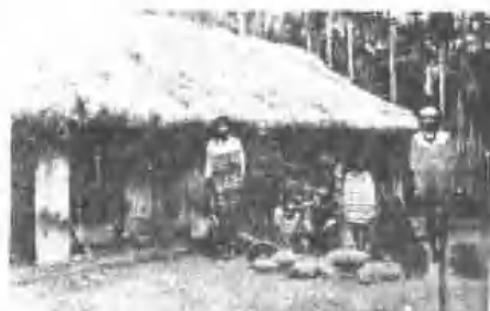
《村埔南鄉安吉縣蓮花》屋住社蔣蔣族美阿