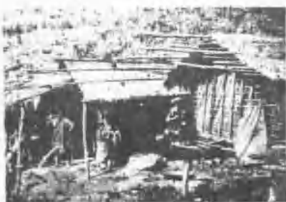
泰雅族部落之房屋(大湖) (大湖)