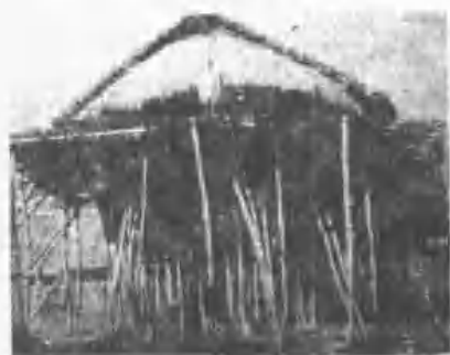
《村南學縣東臺》廟公年少族南學