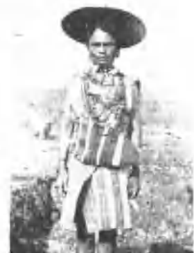
(于帽之成製木刺) 裝服之女屬族美雅 女少族美雅之鍊項貝鵝鸚樹懸