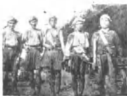
裝服子男之(族南卑)族福巴那巴