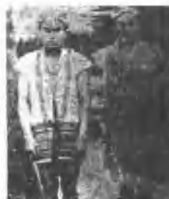
七村豐瑞鄉野鹿縣東臺 裝服子男族美阿社川聯