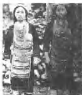
村豐瑞鄉野鹿縣東臺 裝服子女社川聯七