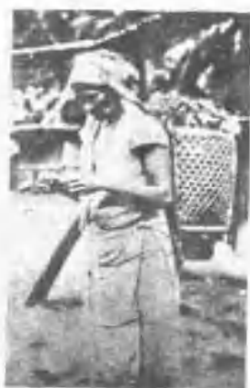
花蓮縣太魯閣族婦女背篋