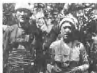
衣上短之女男族美阿