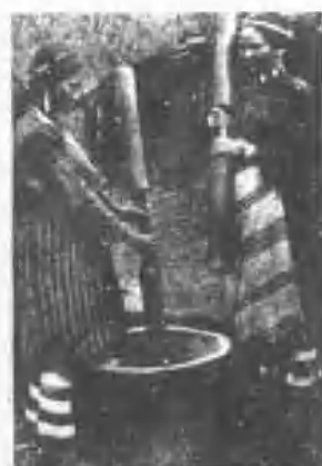
泰雅族婦女之桶米