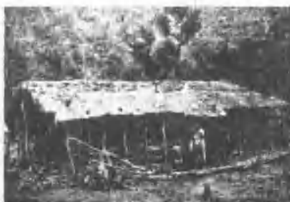
泰雅族部落之房屋(頭橋)