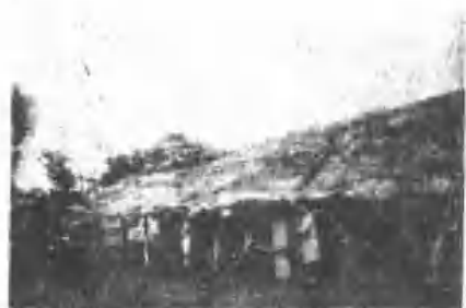
《村安大鄉復光縣蓮花》廟公之社駿太馬族美阿