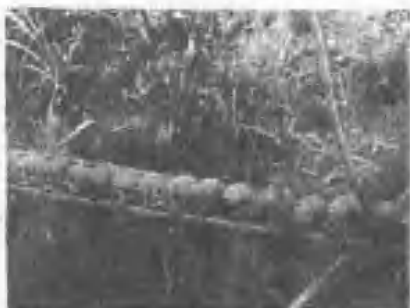
泰雅族部落之房屋(頭橋)