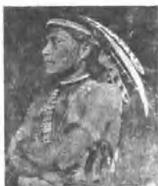
村邦達族曹鳳吳縣義嘉 子兒之家目頭社雅富圖村