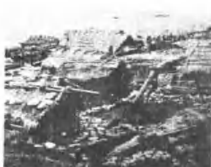
《村頭紅鎮蘭》屋房之族美雅