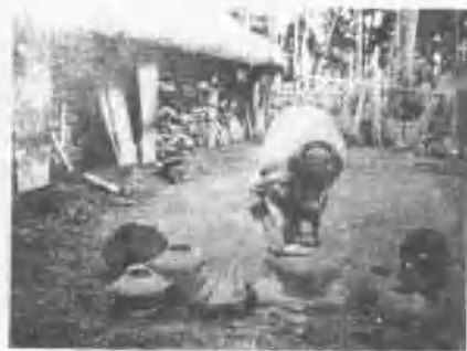
形造之器土族美阿