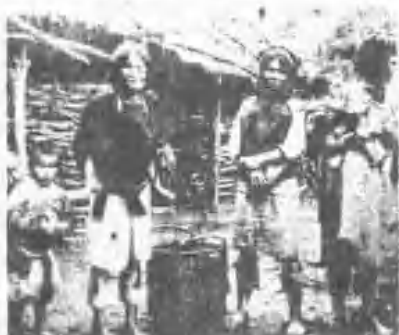
泰雅族部落之房屋(南澳) (南澳)