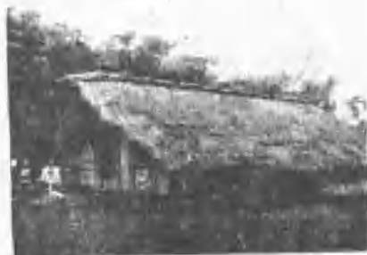
《縣蓮花》一代八十五第一家馬那目頭社聖巴大