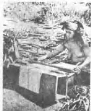
布農族婦女之紡織