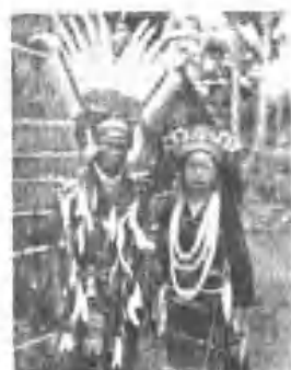
裝盛女男社漏里族美阿縣陸花 (村仁化鄉安吉)