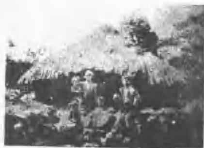
屋住之群山里阿族曹