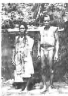
妻夫蘭馬謝長鄉鄉蘭蘭蘭