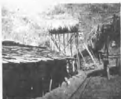
泰雅族部落之房屋(魯閣) (魯閣)