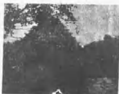
舍穀之(村懷古鄉義來) 島那庫群馬武巴族灣排