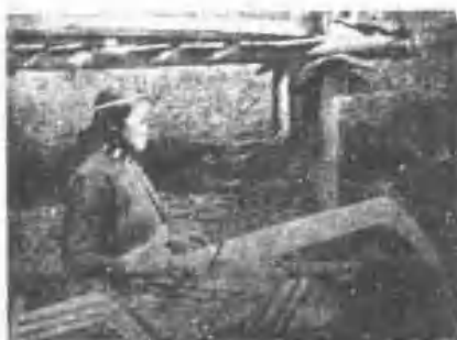
布織之女婦族雅泰