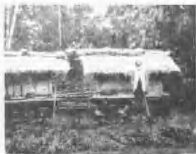
《村里仁鄉安吉蓮花》會穀之社舊族美阿《里三明光、心中、生新鎮東臺現》廟公之社蘭馬族美阿