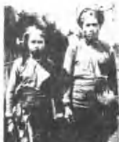
(村南卑)妻夫族南卑