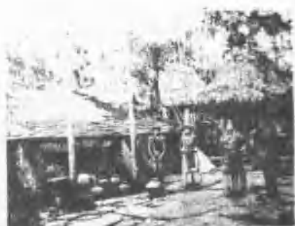
《村平佳鄉武泰縣東麻》屋房之群馬武巴族齊韓