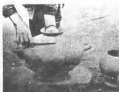
作製器陶女婦族美阿