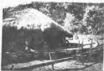
屋住之群社四族曹