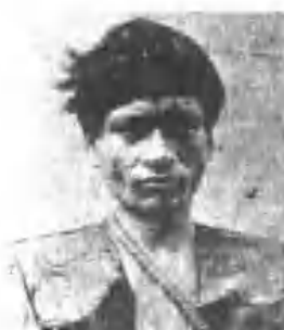
式髮之年青族美雅