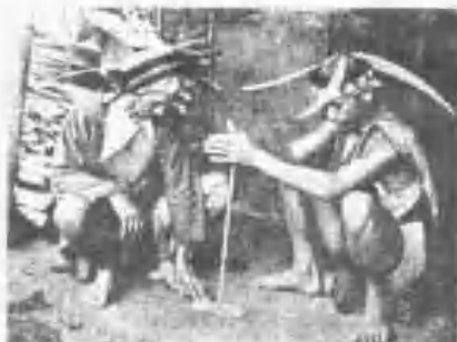
《社邱達那鳳吳》法火取木型族曹