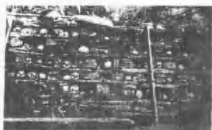
架廟頭之社立卡崩群馬武巴族灣排