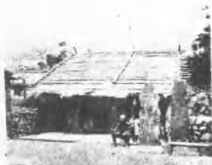
屋房頂屋舊套鄉里麻大縣東臺