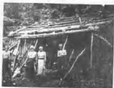
(鄉林秀蓮花) 屋住之華蘭魯太族雅來