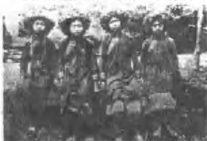
冠花亂頭(社內)女少族圖排村美來鄉義來縣東屏