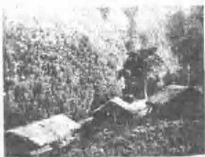
泰雅族部落之房屋(烏來社)