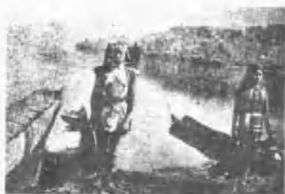
舟木端之族邵潭月日