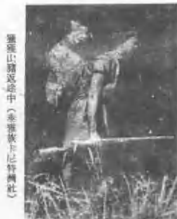
獵獲山豬返途中（泰雅族卡尼特爾社）