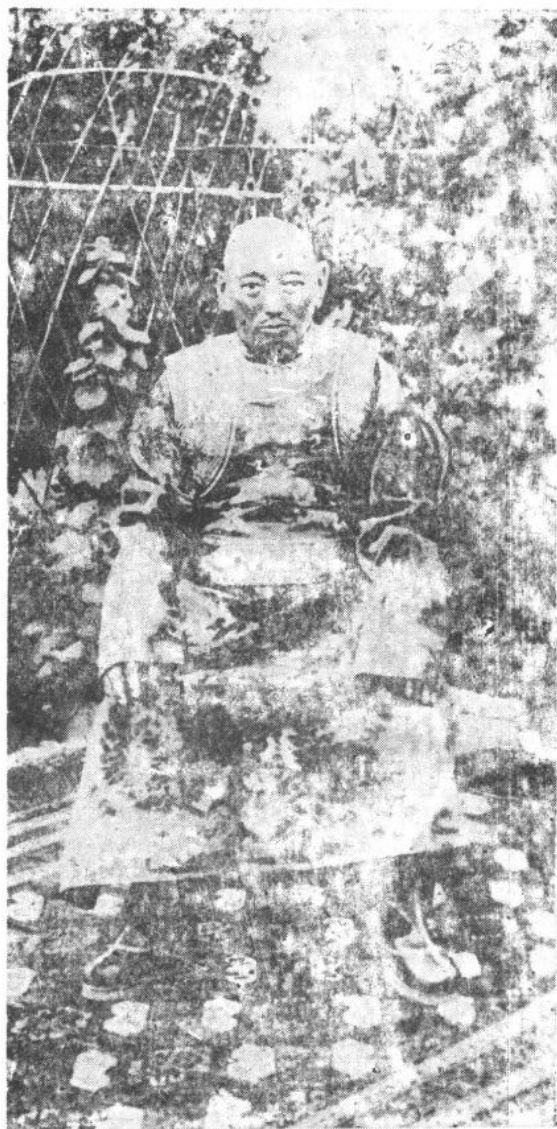
晚年的达赖喇嘛（1932年，56岁）