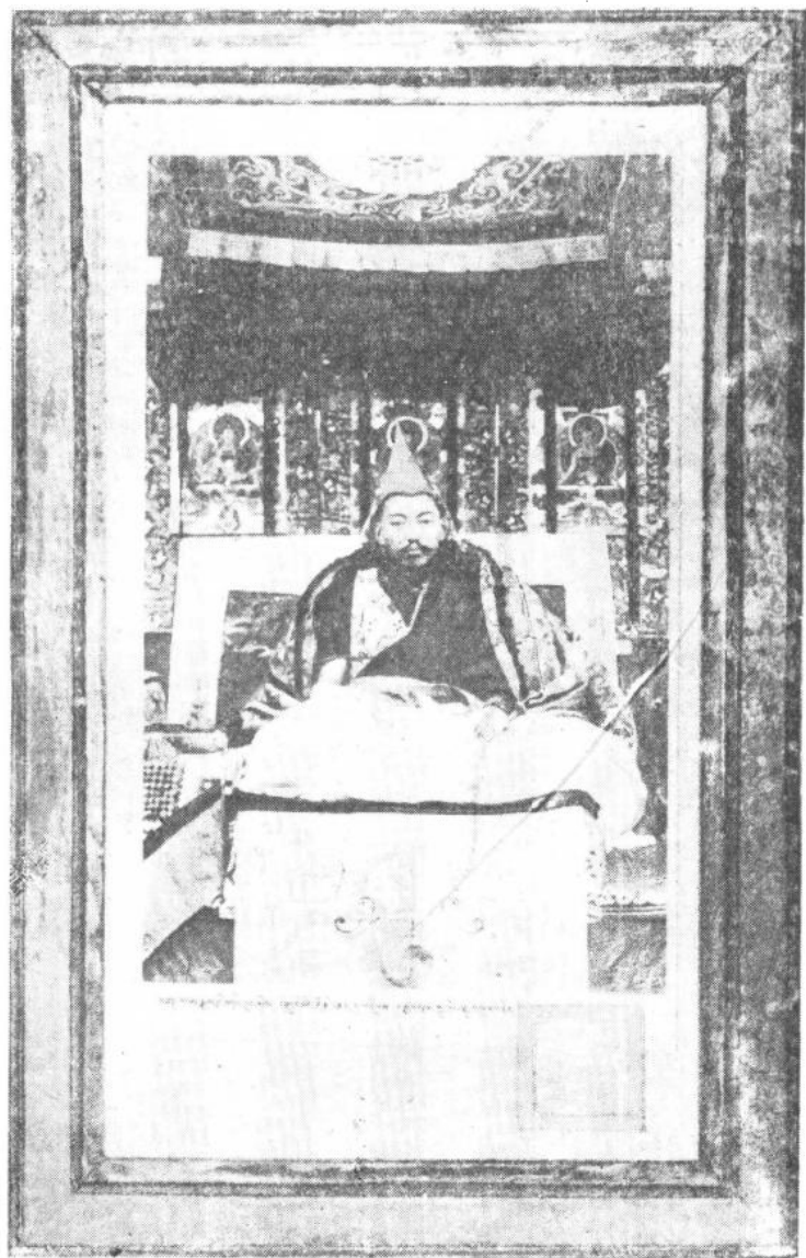
三十四岁的达赖喇嘛