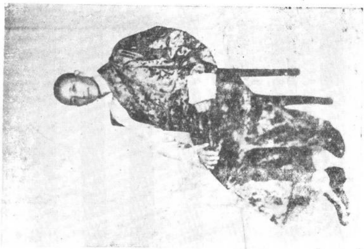
公被拉（达赖喇嘛晚年的心腹）