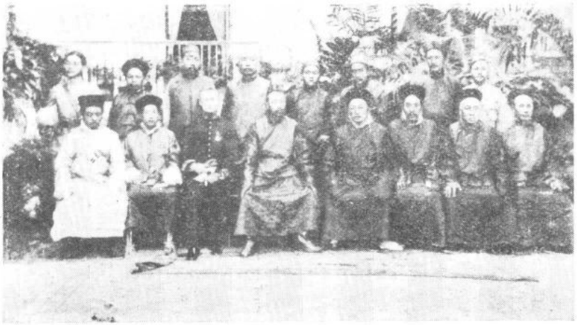
一九一〇年在加尔各答哈斯汀大厦