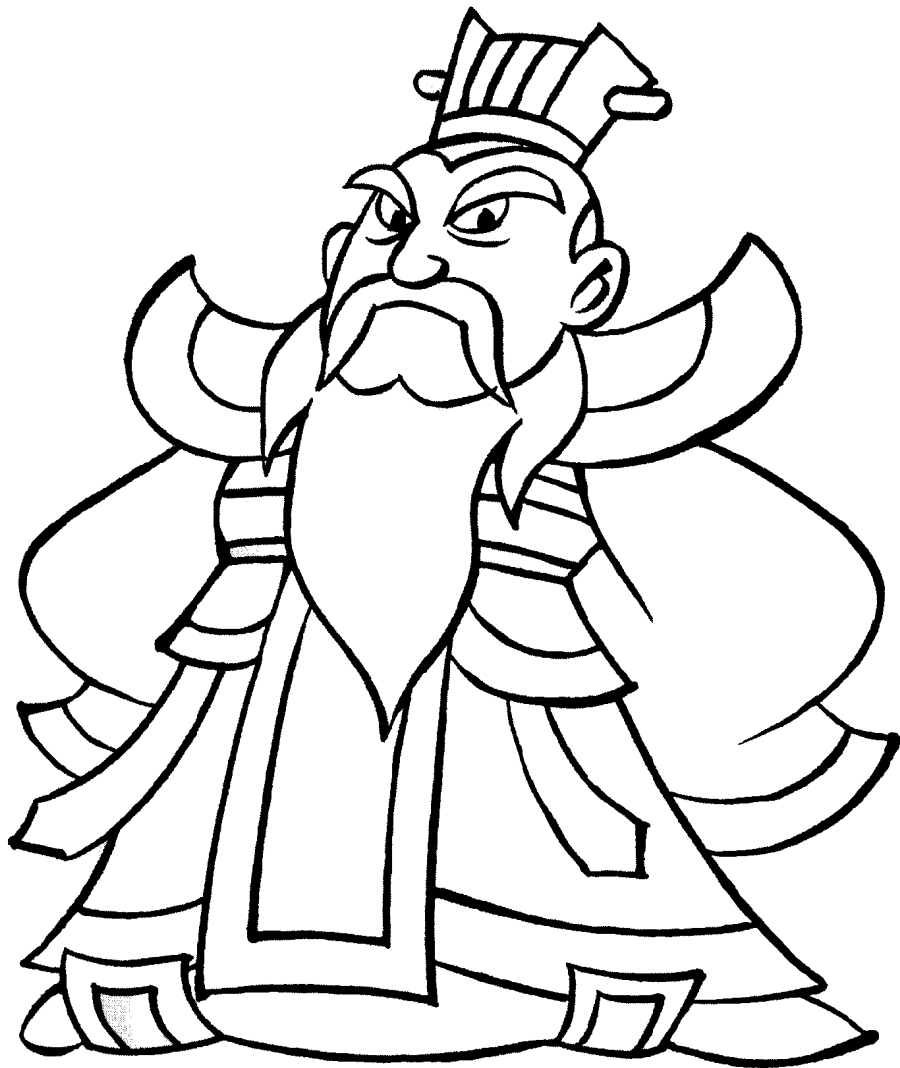
sūn quán 孙权

东吴国主， 长沙太守孙坚的 儿子。他聪明、仁 智，有雄才大略， 善于用人，手下 聚集了江东豪杰 名士，仅帅才就 有周瑜、吕蒙、陆 逊等。他凭借长 江天险，稳坐江 东，与曹操、刘备 鼎足三分，建立 东吴帝国。