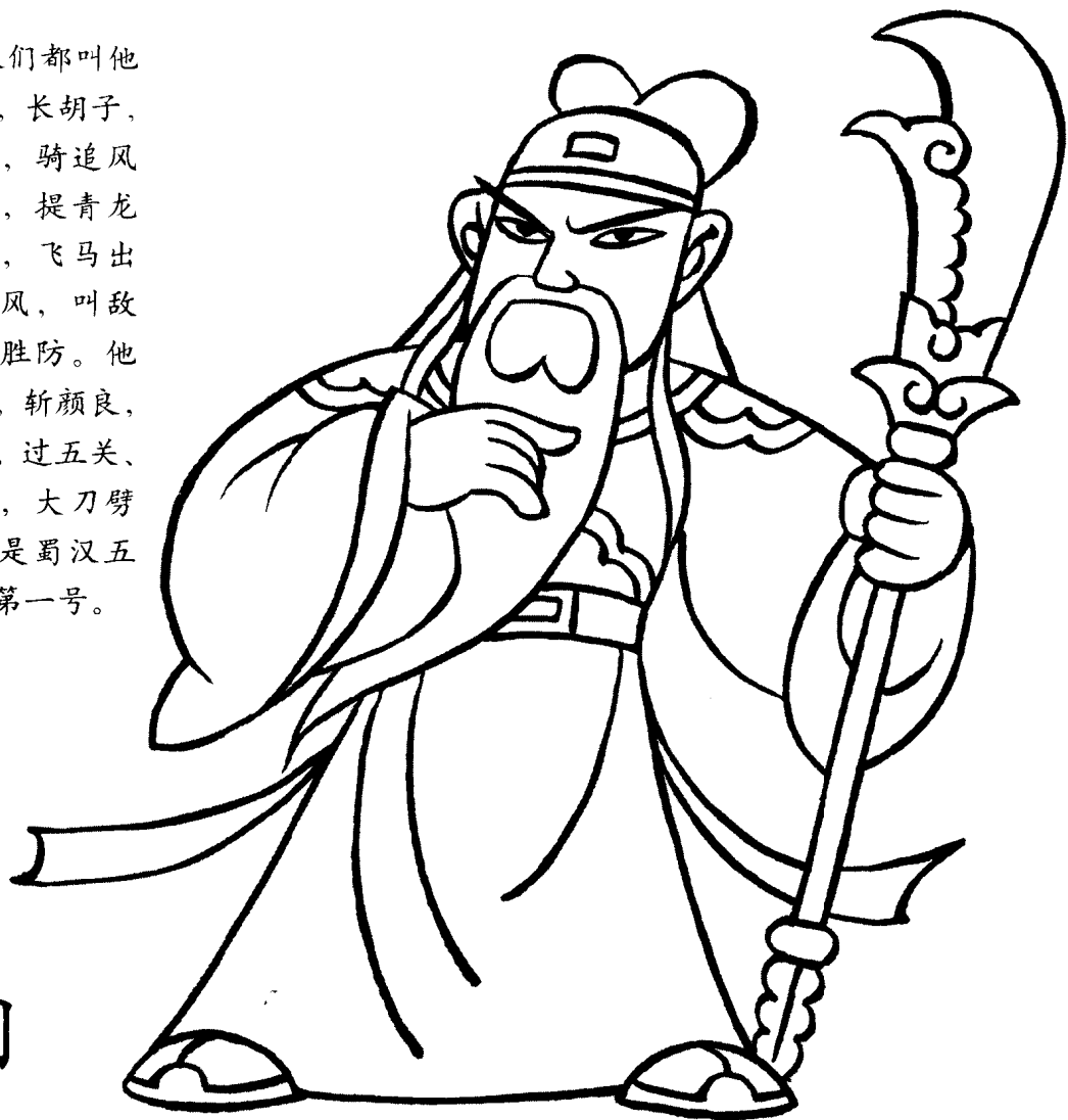
guān yǔ 关羽

人们都叫他 “关公”，长胡子， 红脸膛，骑追风 赤兔马，提青龙 偃月刀，飞马出 阵快如风，叫敌 人防不胜防。他 砍华雄，斩颜良， 杀文丑，过五关、 斩六将，大刀劈 蔡阳，是蜀汉五 虎上将第一号。