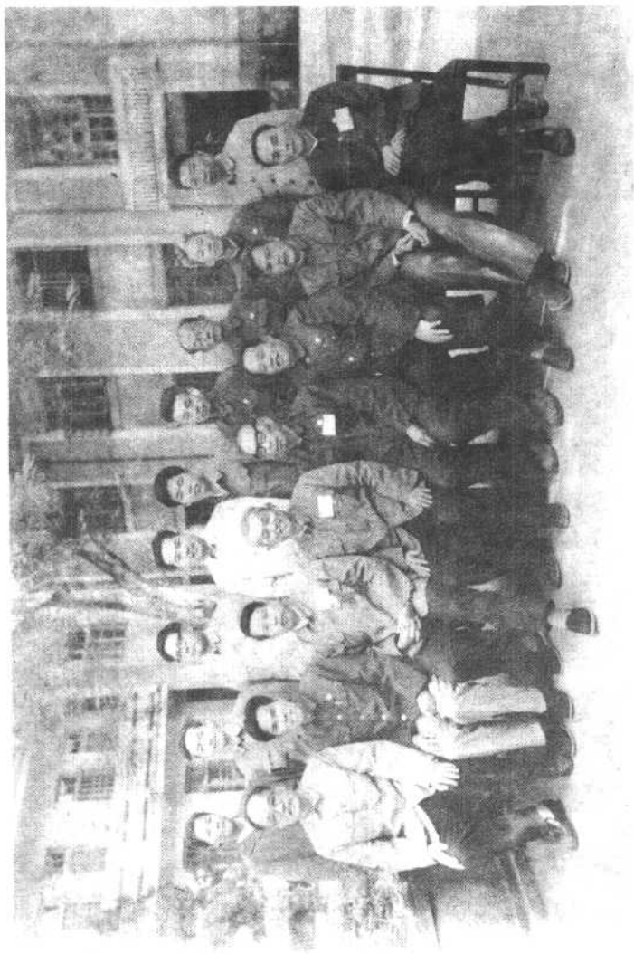
第二届政协常委会