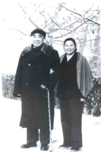
▲ 朱德夫妇送给作者的照片