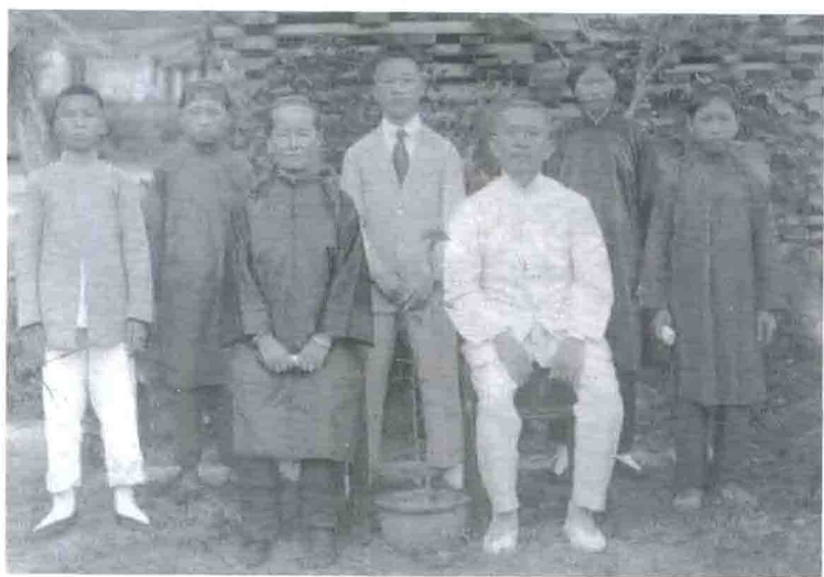
祖父、祖母、父亲、叔父、母亲、姑姑和叔姆。1930年，全家合影于溪角老屋光裕楼门前。