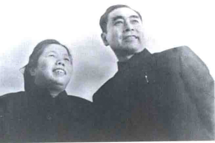
▲ 周恩来夫妇送给作者的照片