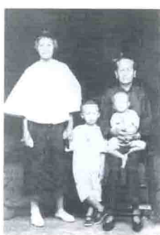
外婆抱着作者与母亲和哥哥于1927年摄于白宫照像馆。