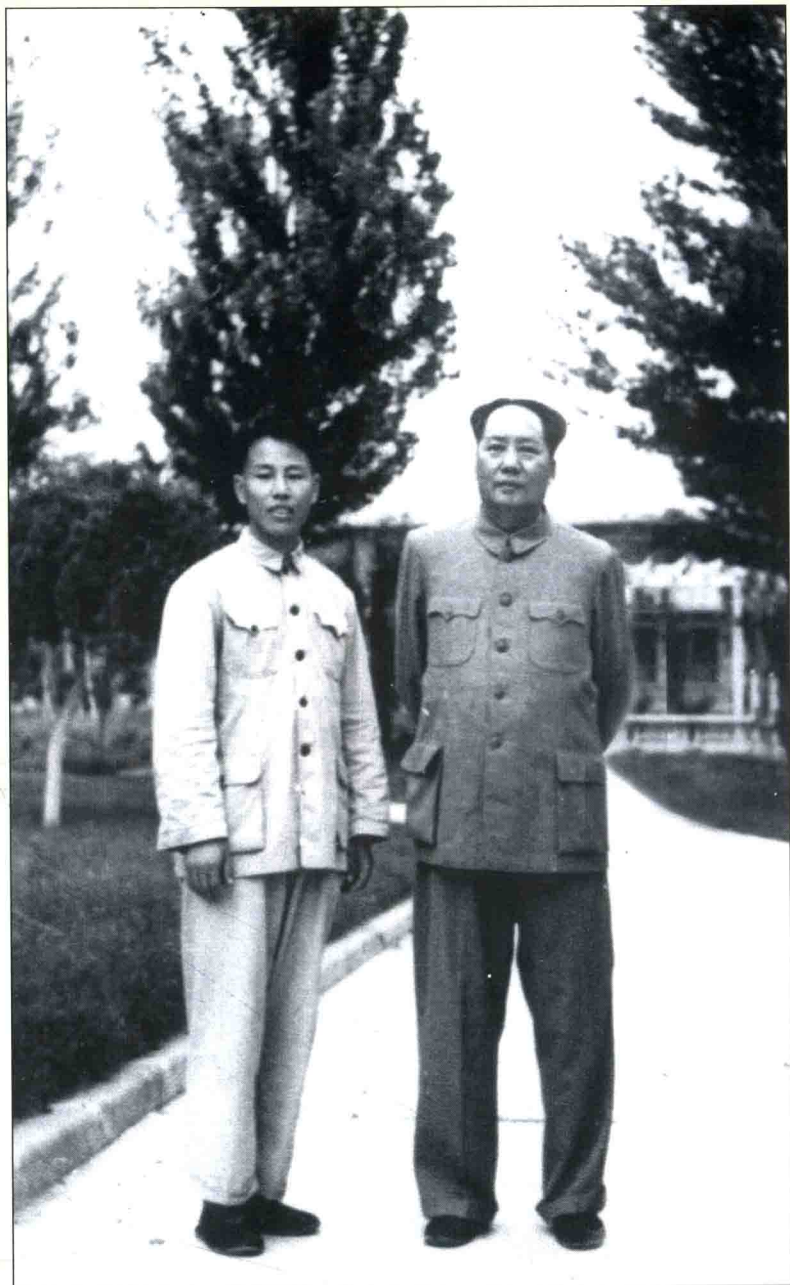
作者的丈夫王鹤滨和毛泽东主席1954年合影于北京。