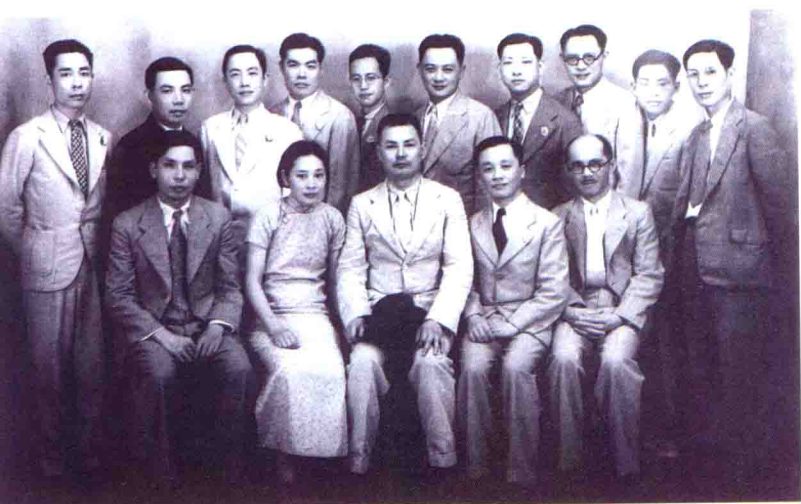
▲ 1938年叶剑英（前左3）偕夫人曾宪植（前左2）在香港和父亲李瑞文（前右2）等梅县乡亲合影。