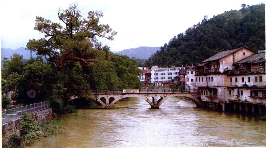
白宫“近仙桥”（上桥）（2005年9月摄）