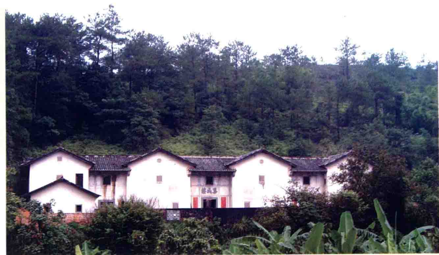
集成楼全景（2005年8月摄）