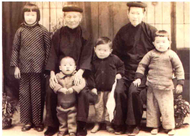
作者(左一)11岁时与祖母(左二)、丘婆(外婆)、弟弟妹妹合影。