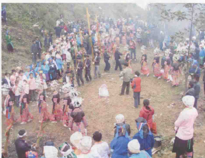
◆摆垭山地区苗族群众载歌载舞庆祝习俗改革