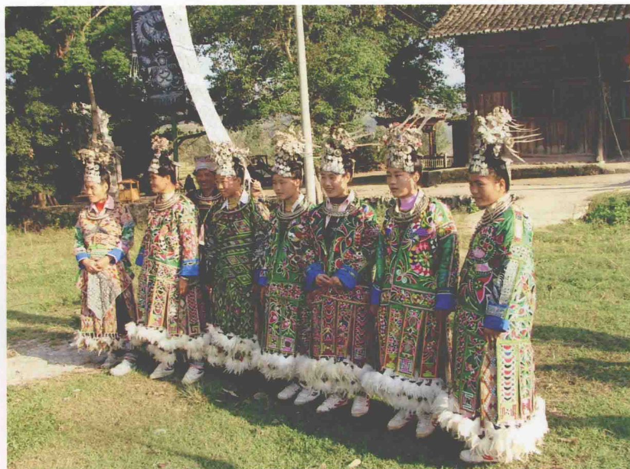
◆兴华摆贝苗族百鸟衣