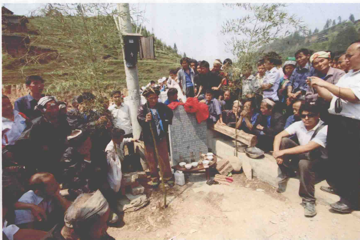
◆2009年3月21日，八开南部地区苗族习俗改革栽岩仪式