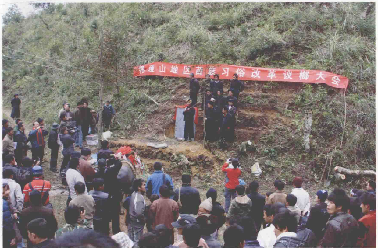
◆ 2009 年 11 月 18 日, 摆垭山地区苗族习俗改革议榔大会栽岩仪式