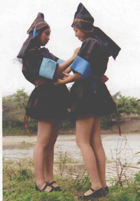
◆两汪短裙苗族服饰