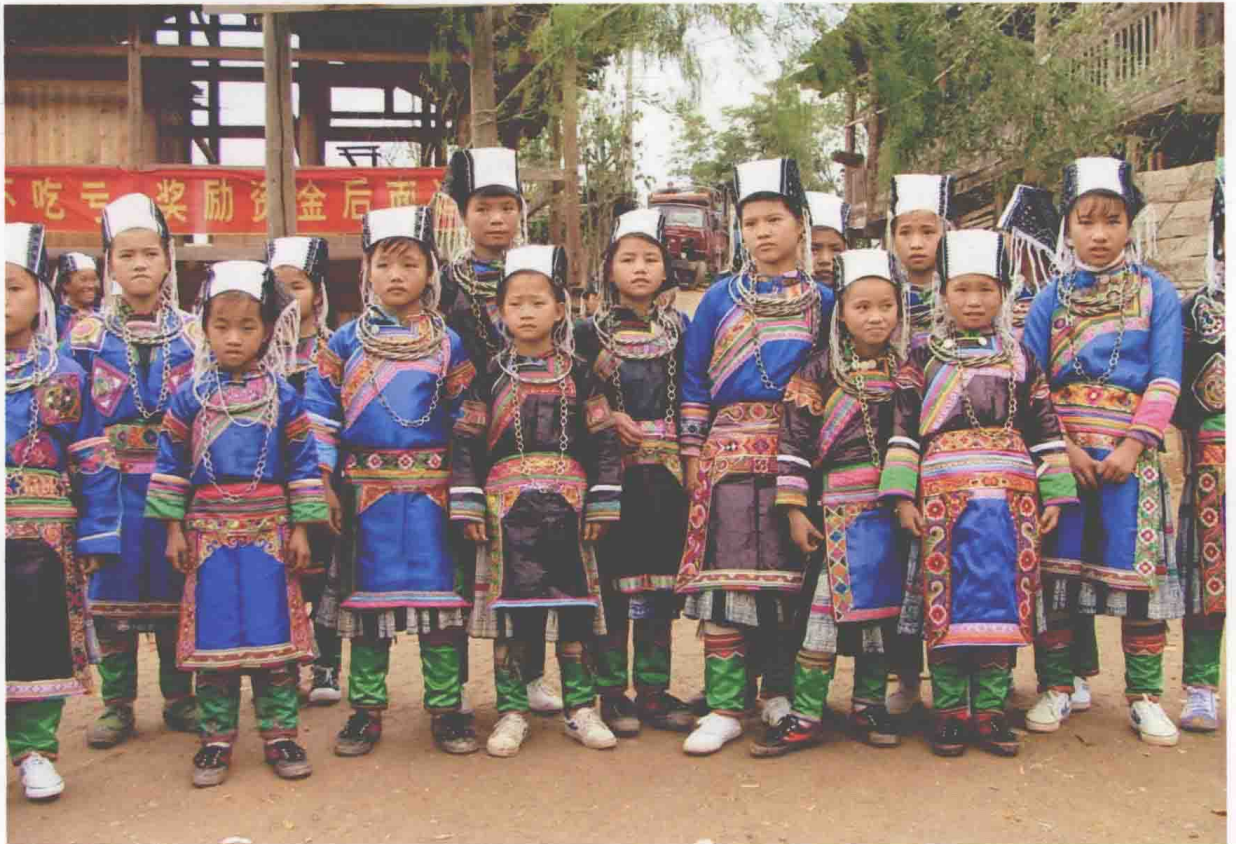
◆ 平江滚仲苗族女童