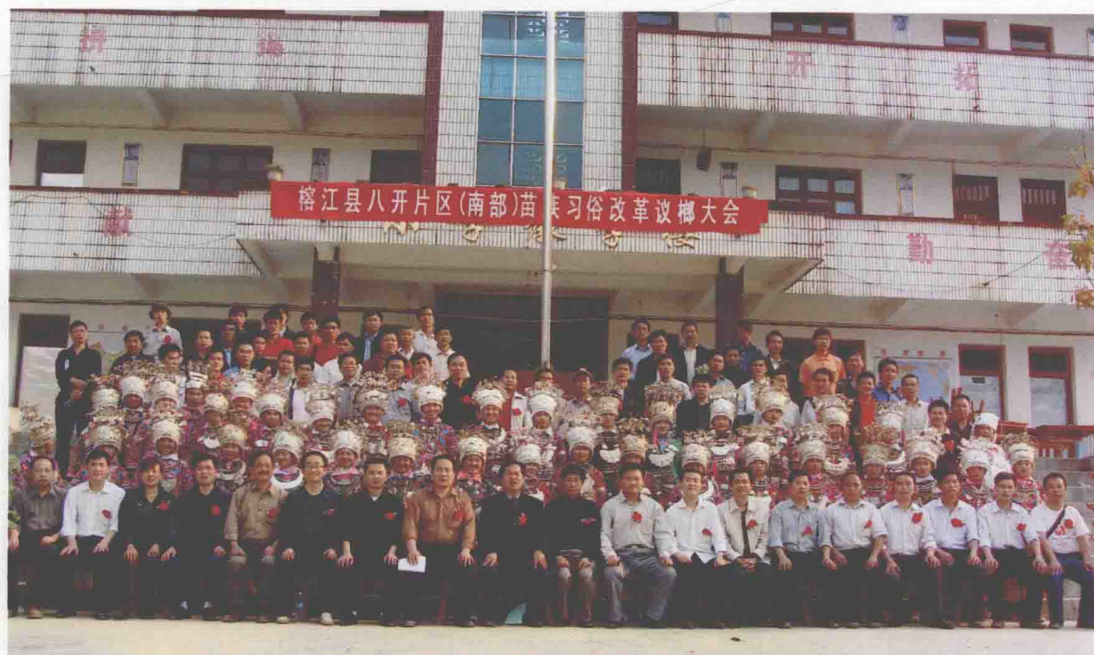
◆榕江县八开南部地区苗族习俗改革议榔大会代表和县苗学会领导成员合影