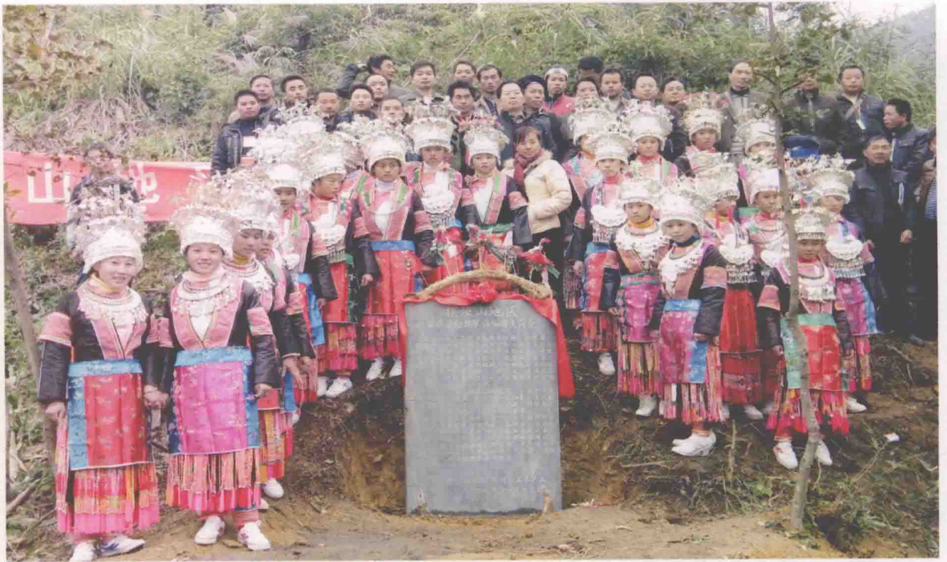
参加摆垭山苗族习俗改革议榔大会代表与县苗学会领导合影