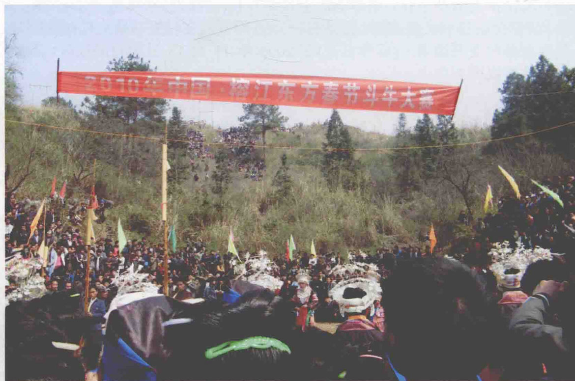
◆二〇一〇年中国·榕江春节东方斗牛大赛赛场