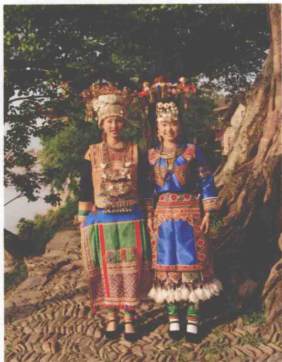
◆左：朗洞卡寨苗族妇女服饰 右：平江滚仲苗族妇女服饰