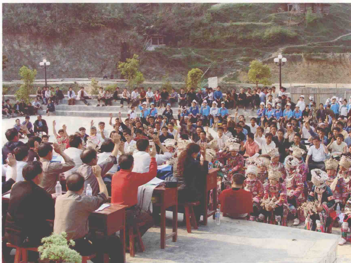
◆参加榕江县八开南部地区苗族习俗改革议榔大会代表表决通过习俗改革榔规