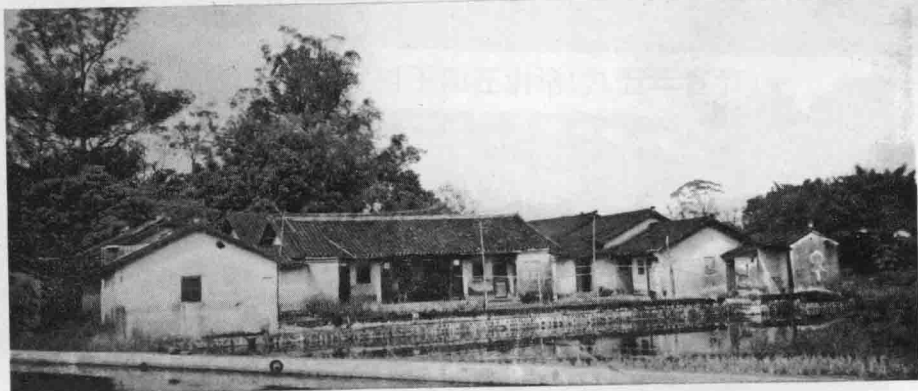
田螺岈坑背围屋 保成公(十六世)创造