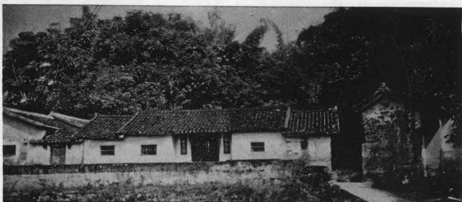
田螺岙君佩公祠 君佩公(九世)创造