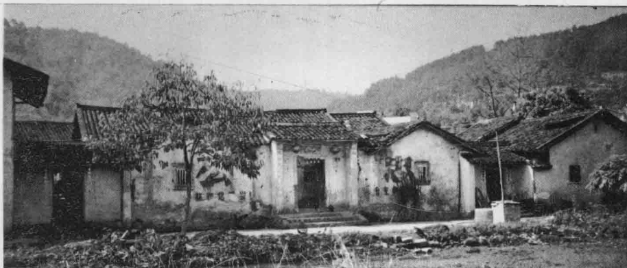
燕谿居(新屋下) 朝忠公(十五世)创造