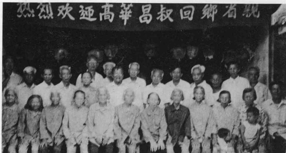
老人会干部和八十岁以上会员欢迎华侨回乡省亲合影(九九年七月)