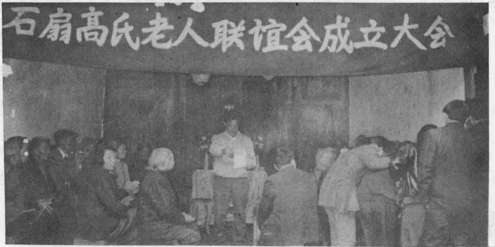
老人会成立时村干部在讲话(九五年春节)