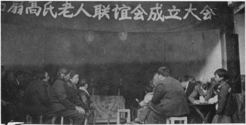
老人会成立时新选会长在讲话(九五年春节)