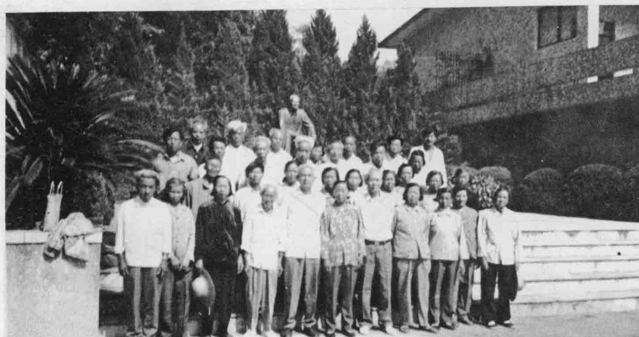
老人会组织会员旅游参观叶帅纪念馆留影(九八年老人节)