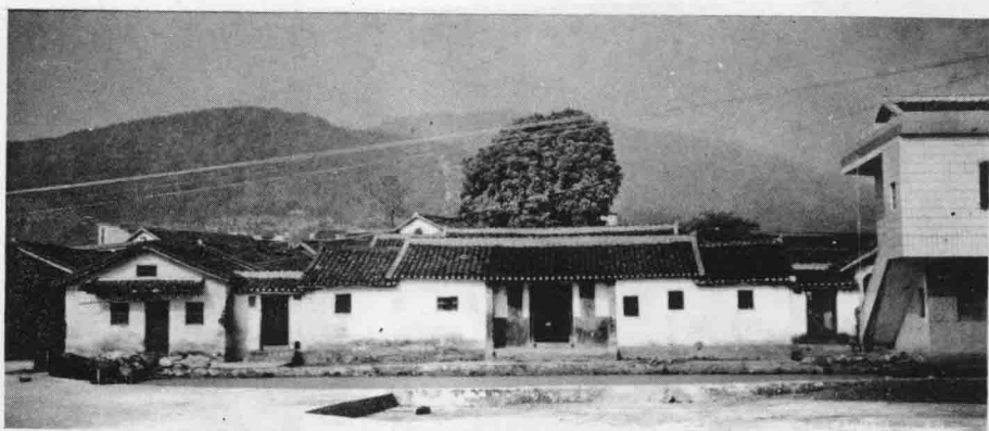
荷卵树下老屋 必仁公之曾孙祖发公(五世)创造