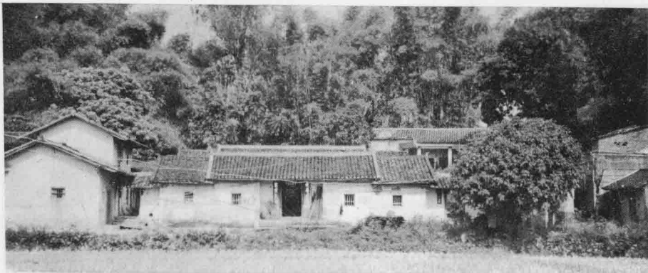
田螺岷下屋 伟盛公(一世)创造