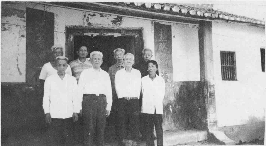
老人会主要干部合影(九九年十一月)