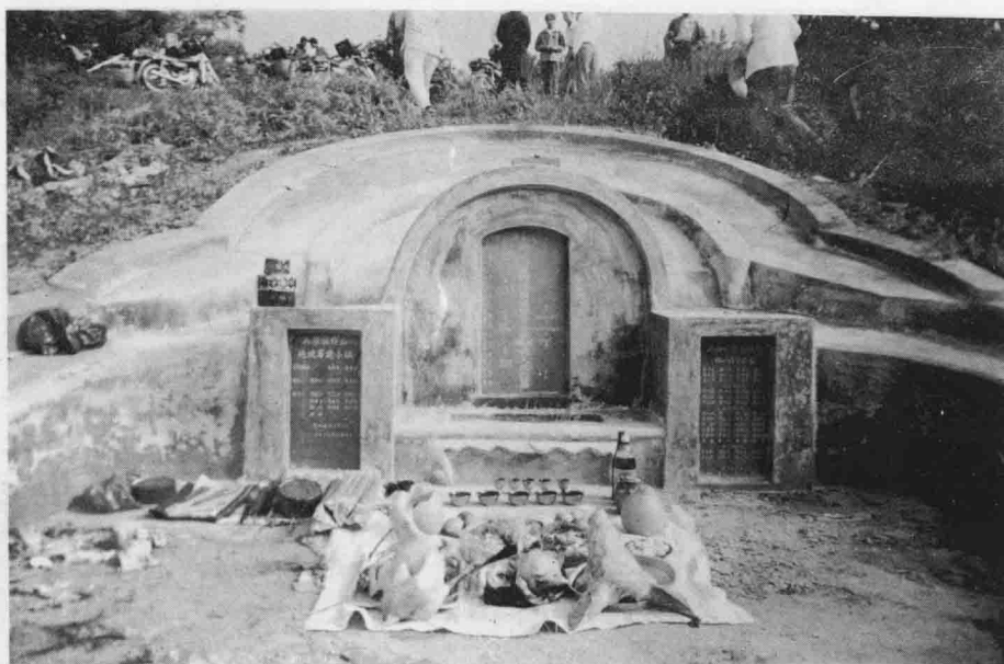
祖发公(五世)墓 一九九九年重修