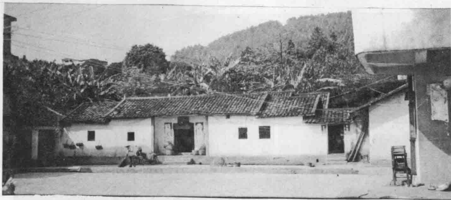
象村子老屋 必达公之曾孙仰祖公(五世)创造