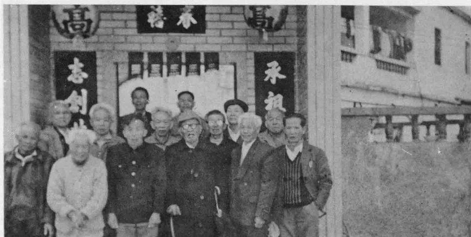
老人会干部大年初一向老人拜年合影(九七年春节)