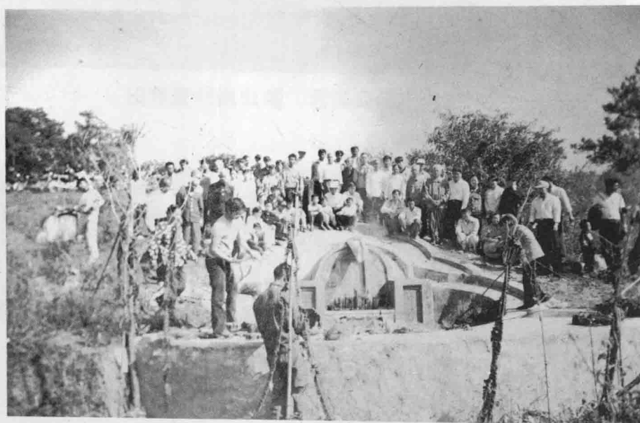
重修祖发公墓园坟盛况 一九九九年十一月六日