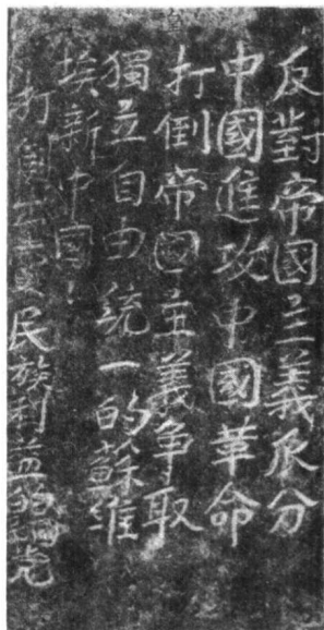
红四方面军在 北路丁部在关 宁强县城上 镇旧墓碑上 刻的标语 (中共宁强县 县委党史办 供稿)