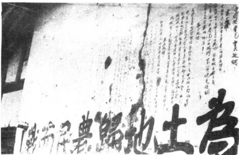
红四方面军在镇巴县伍家乡苏家坡村墙壁上写的《中国共产党十大政纲》