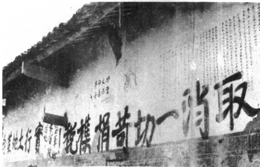
红四方面军在镇巴县伍家乡苏家坡村墙壁上写的标语 (中共镇巴县委党史办供稿)