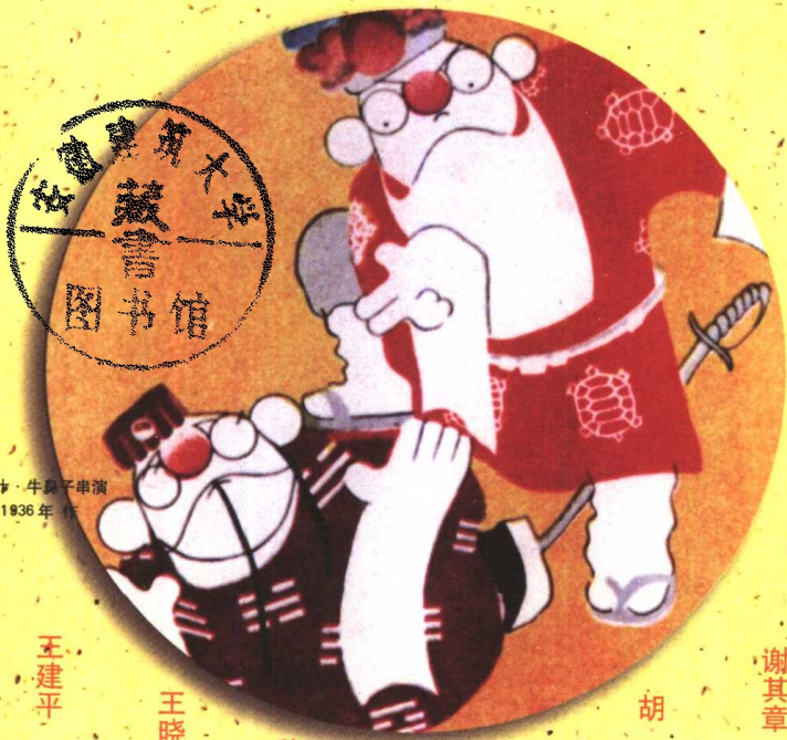
戳穿空城计·牛鼻子串演 黄尧 1936年作