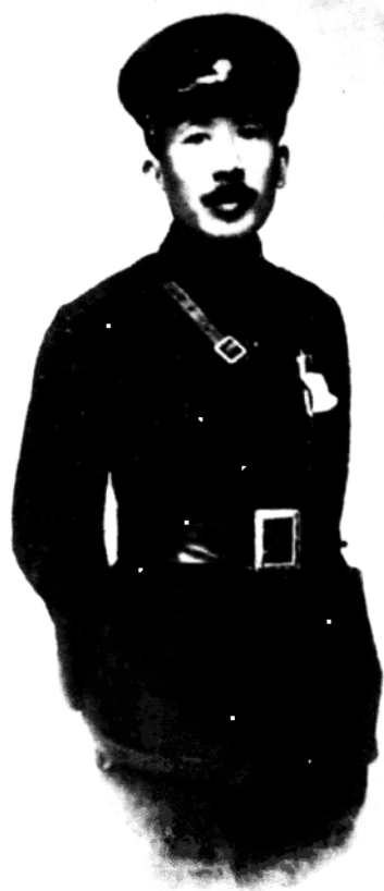
蔡公时烈士遗像 (公元 1881—1928 年)