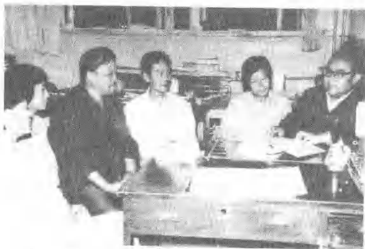
△土良纳同志(右1)与科室职工研究标准化工作计划。