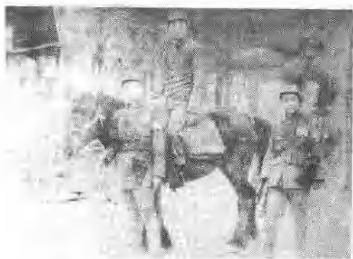
△老红军钟云元(中)在长征时的照片。