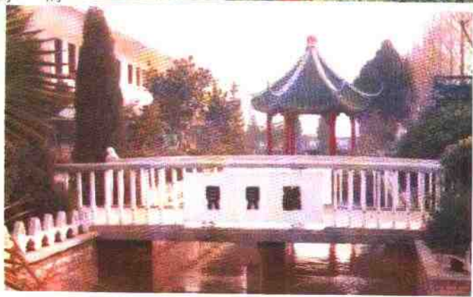
像花园一样秀丽迷人的和合镇中心小学校园