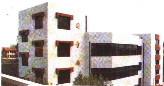
一九九一年建成的藏书丰富的启东市中学图书馆