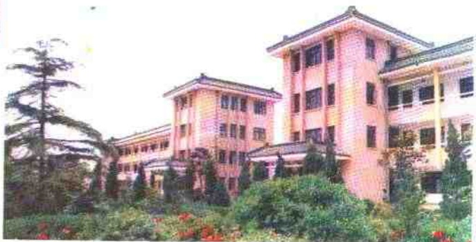
体现传统建筑风格的长江中学教学大楼，一九九二年被南通市评为教育系统十佳建筑之一。