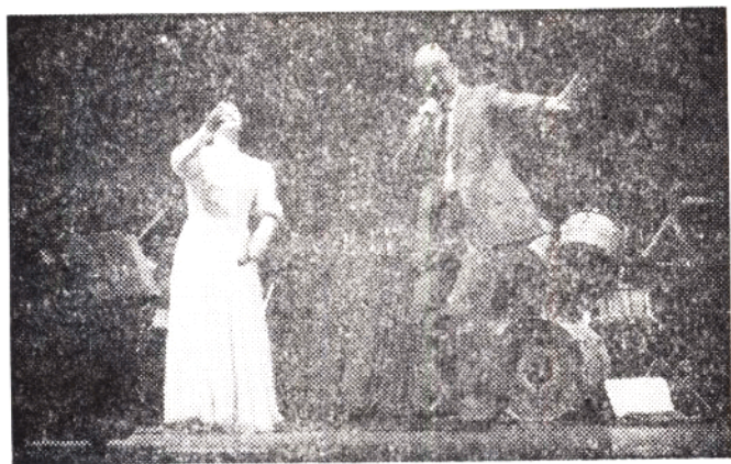
文艺晚会即景