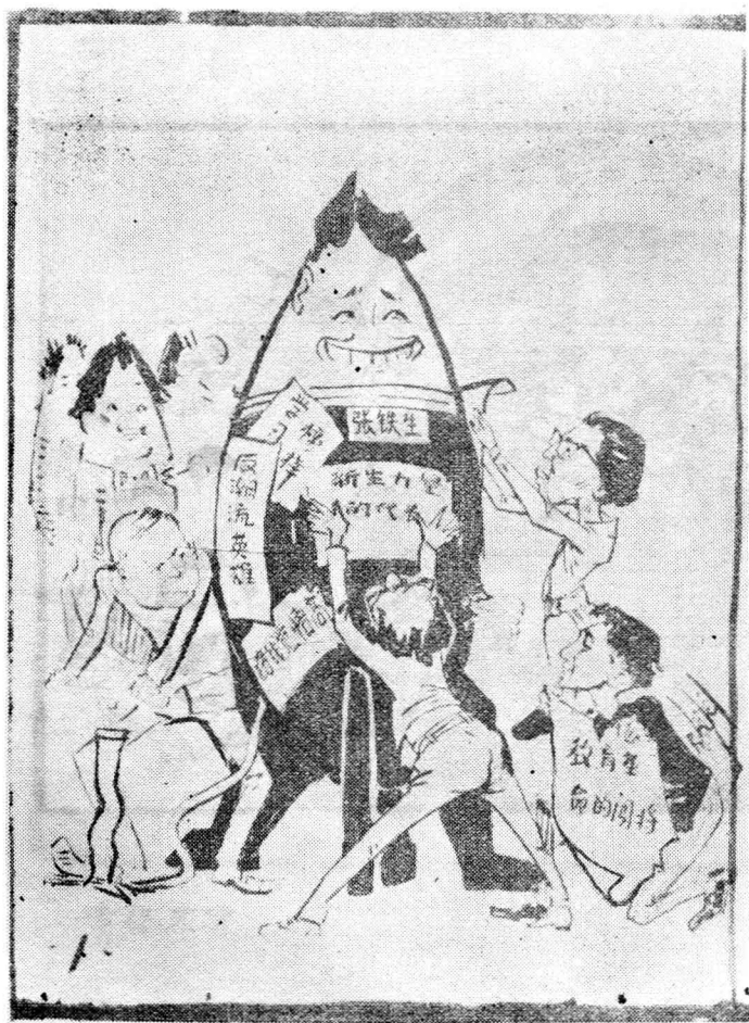
吹起来 （「白卷」典型之一）