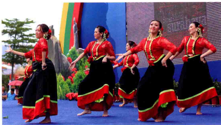
▼艺术团体的精彩演出