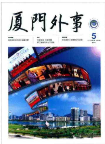
2012年第2期 总第5期 夏季刊