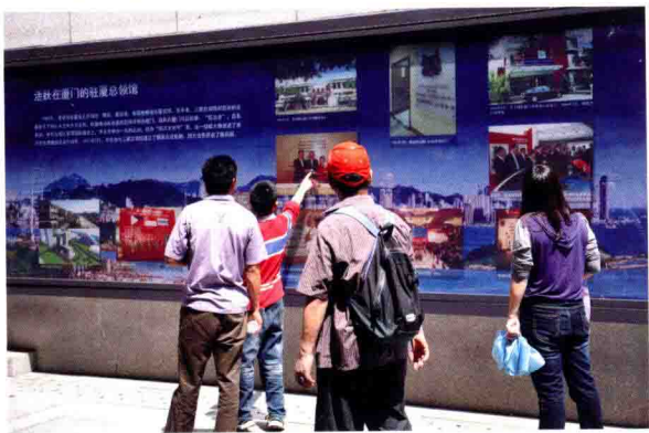
◀ 厦门市民驻足观看图片展