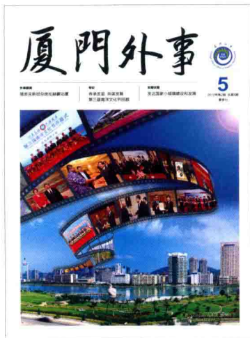
2012年第2期 总第5期 夏季刊