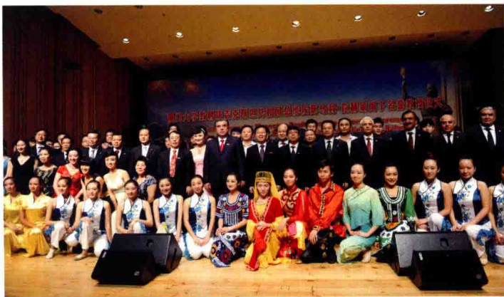
▼拉赫蒙总统访问厦门大学

2日下午，拉赫蒙总统出席了“塔吉克斯坦投资机遇”说明会。该说明会由塔吉克斯坦共和国政府主办，由福建省人民政府、厦门市人民政府协办，紫金矿业集团承办。总统在说明会上发表演讲。他说，近10年