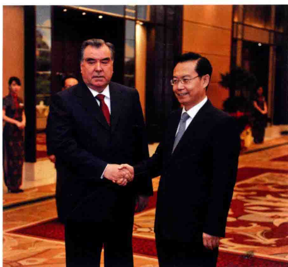
► 福建省省长苏树林会见拉赫蒙总统一行