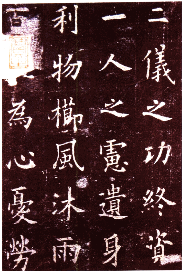
唐 歐陽詢九成宮碑