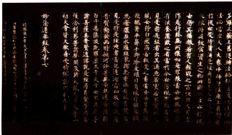
五代 妙法蓮華經卷第七