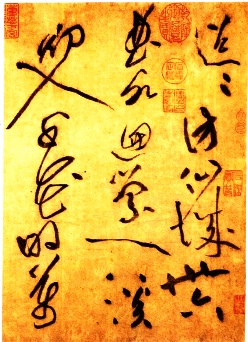
宋 黃庭堅 李白憶舊游詩卷