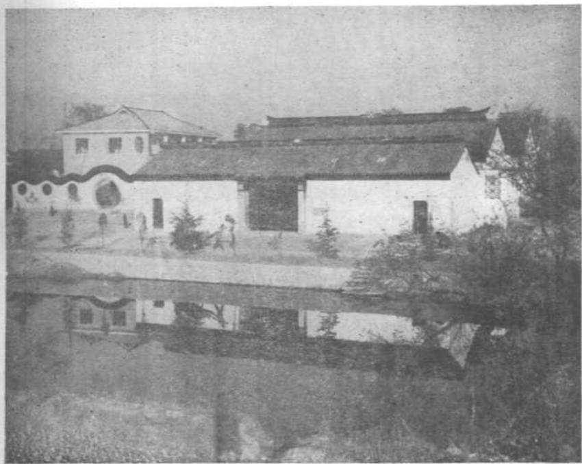
新四军江南指挥部旧址陈列馆。