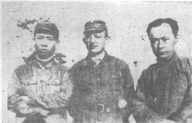
新四军代理军长陈毅（右）、政 治委员刘少奇（左）与奥地利医生罗 生特合影。