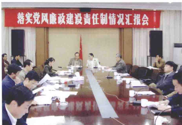
2004年11月15日，我市召开落实党风廉政建设责任制情况汇报会