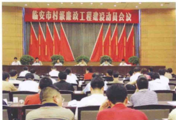
2005年7月7日，我市召开村级廉政工程建设动员会