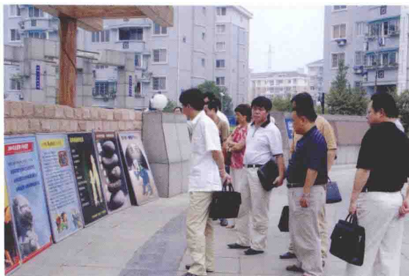
2005年7月7日，全市纪检干部参观马溪社区廉政文化建设