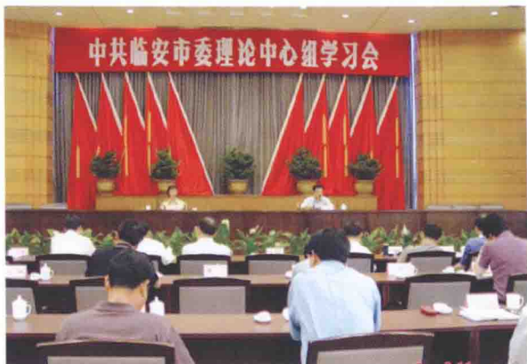
2005年6月2日，市委理论中心组专题学习中共中央《建立健全教育、制度、监督并重的惩治和预防腐败体系实施纲要》