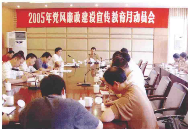
2005年8月10日，我市召开党风廉政建设宣传教育月动员会