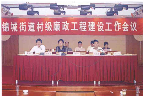
2005年9月16日，锦城街道召开村级廉政工程建设工作会议