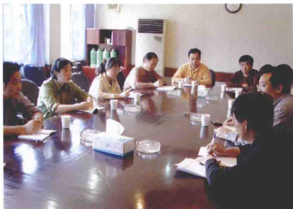
2004年10月21日，杭州市纪委来我市调研整治“两不”行为情况