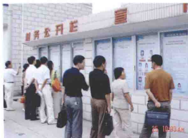
2005年8月25日，我市组织部分乡镇街道农村干部考察余杭区基层民主政治建设