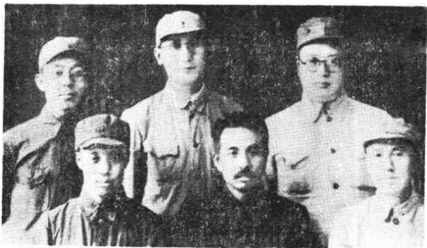
中共辽吉省委部分领导干部合影。前排中为陶铸，1946年6月至1948年7月任辽吉省委书记兼辽吉军区政委。前排右为邓华，1946年6月至1947年8月任辽吉军区司令员。