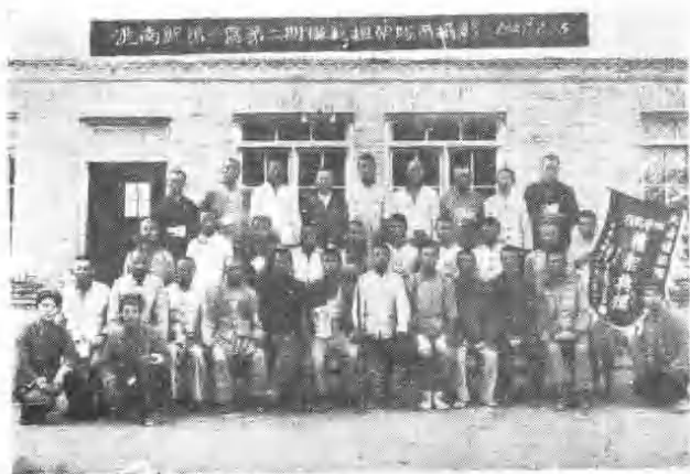
洮南县受到嘉奖的担架队员。