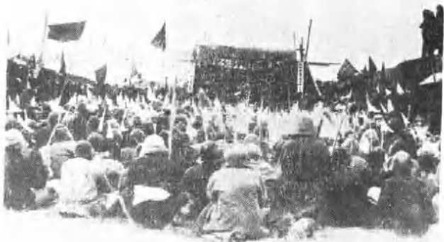
洮安县三合区雇贫农联合斗争大会。