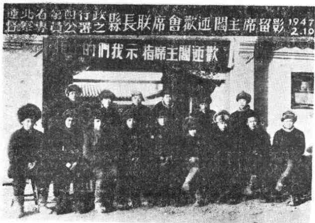
前排中为阎宝航，1947年2月至1949年5月任辽北省政府主席。