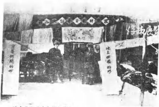
洮安县土改斗争果实展览。