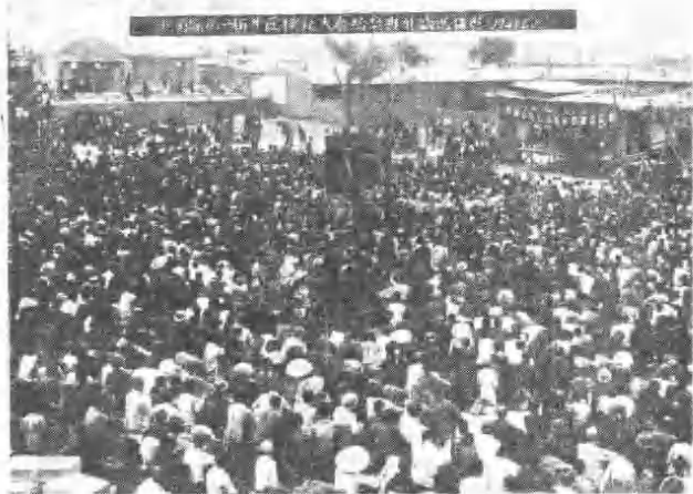
洮南县于1947年6月10日召开第一届生产模范大会。